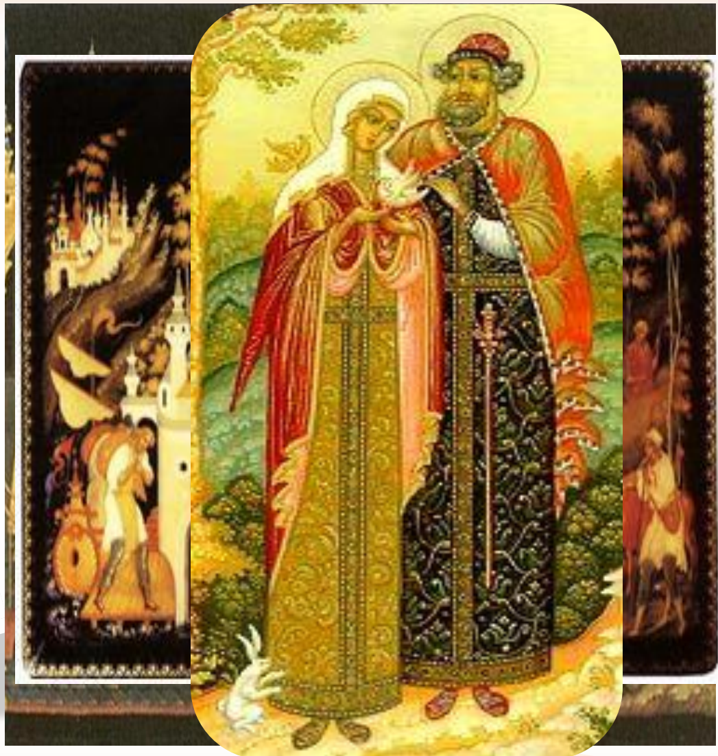
Петр и Феврония Любовь и Верность Навсегда