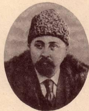
Д. Н. МАМИН-СИБИРЯК

Так писал Мамин-Сибиряк много лет спустя, находясь вдали от родного Висима.