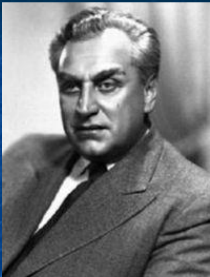
Александров Григорий Васильевич