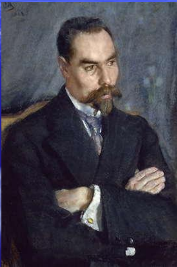
В.Я.Брюсов (1873–1924). Портрет работы С.В.Малютина. 1913 г.