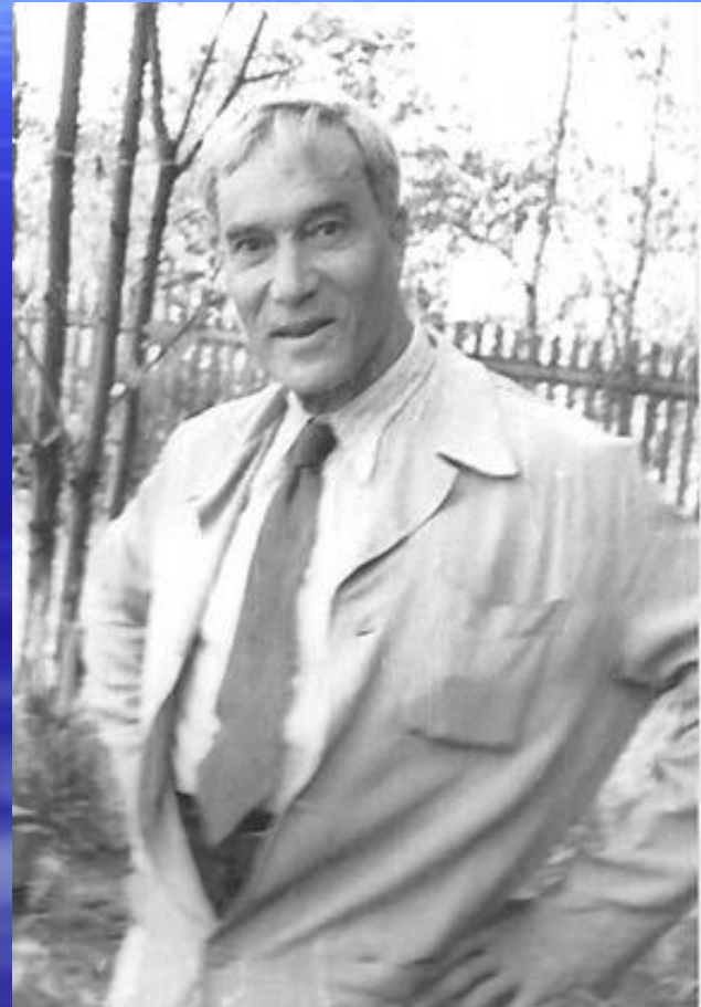
■ Б.Л. Пастернак (1890–1960).