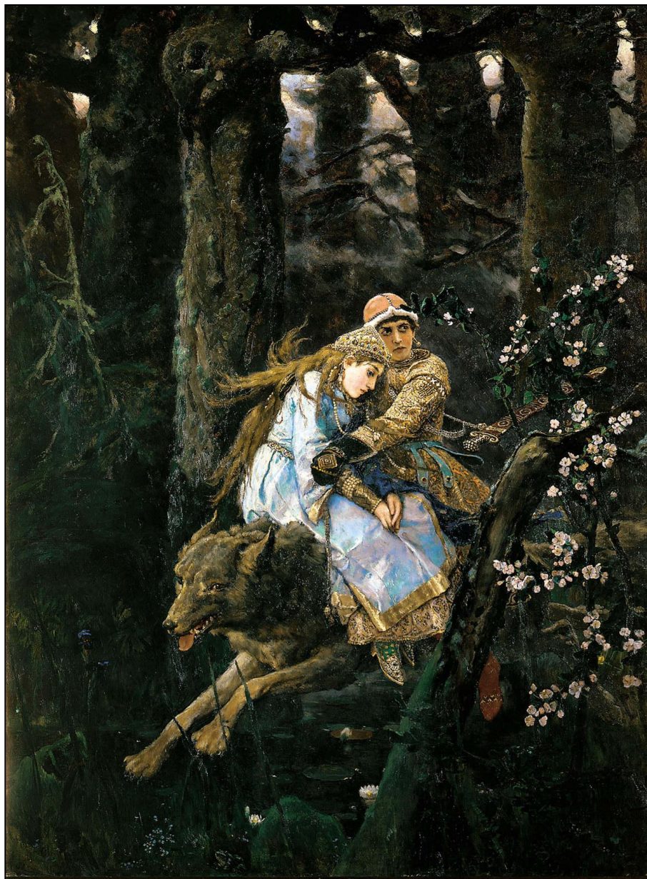
«Иван-царевич и Серый волк» (1889, ГТГ)