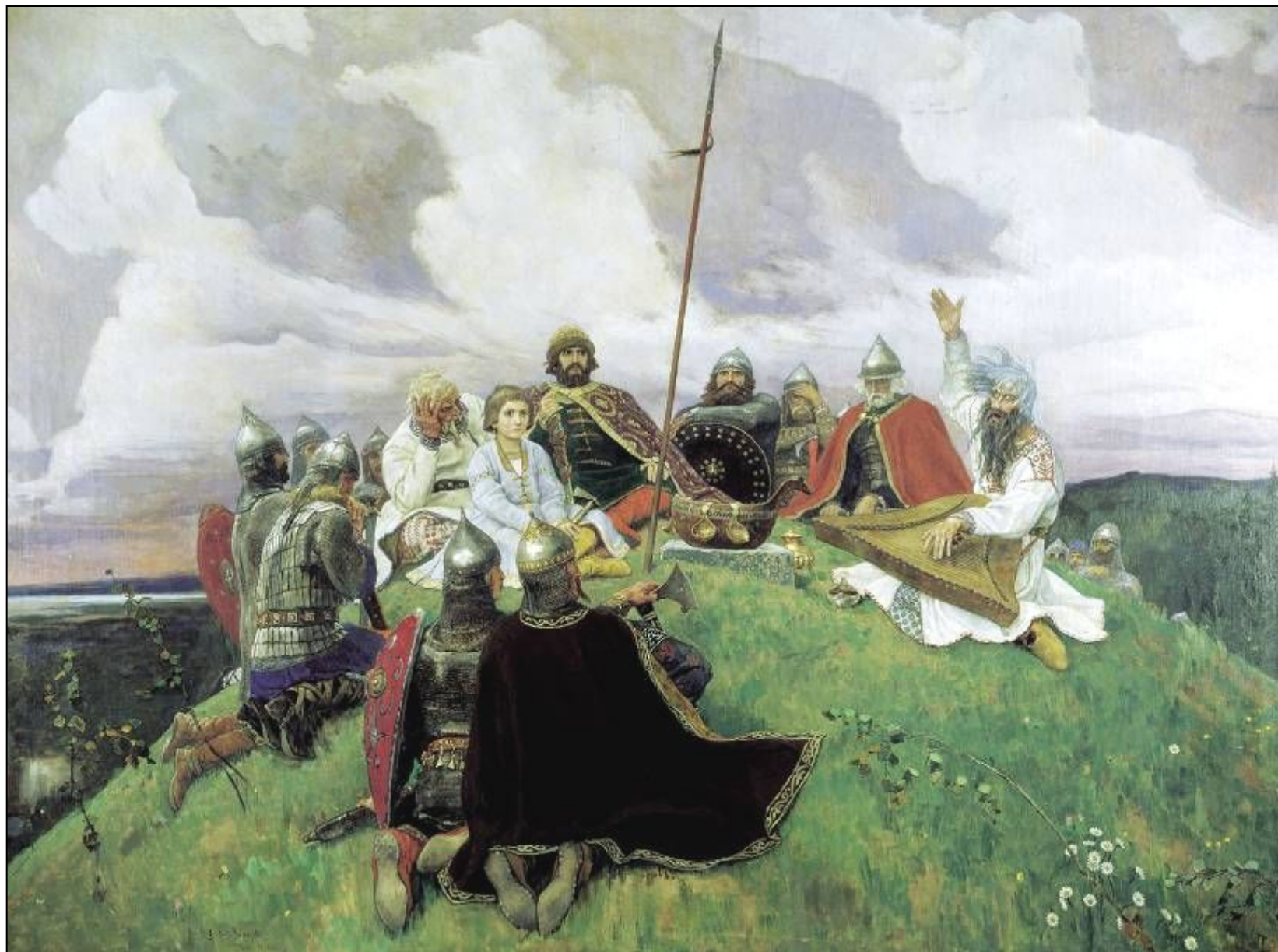
«Баян» (1910, ГРМ)