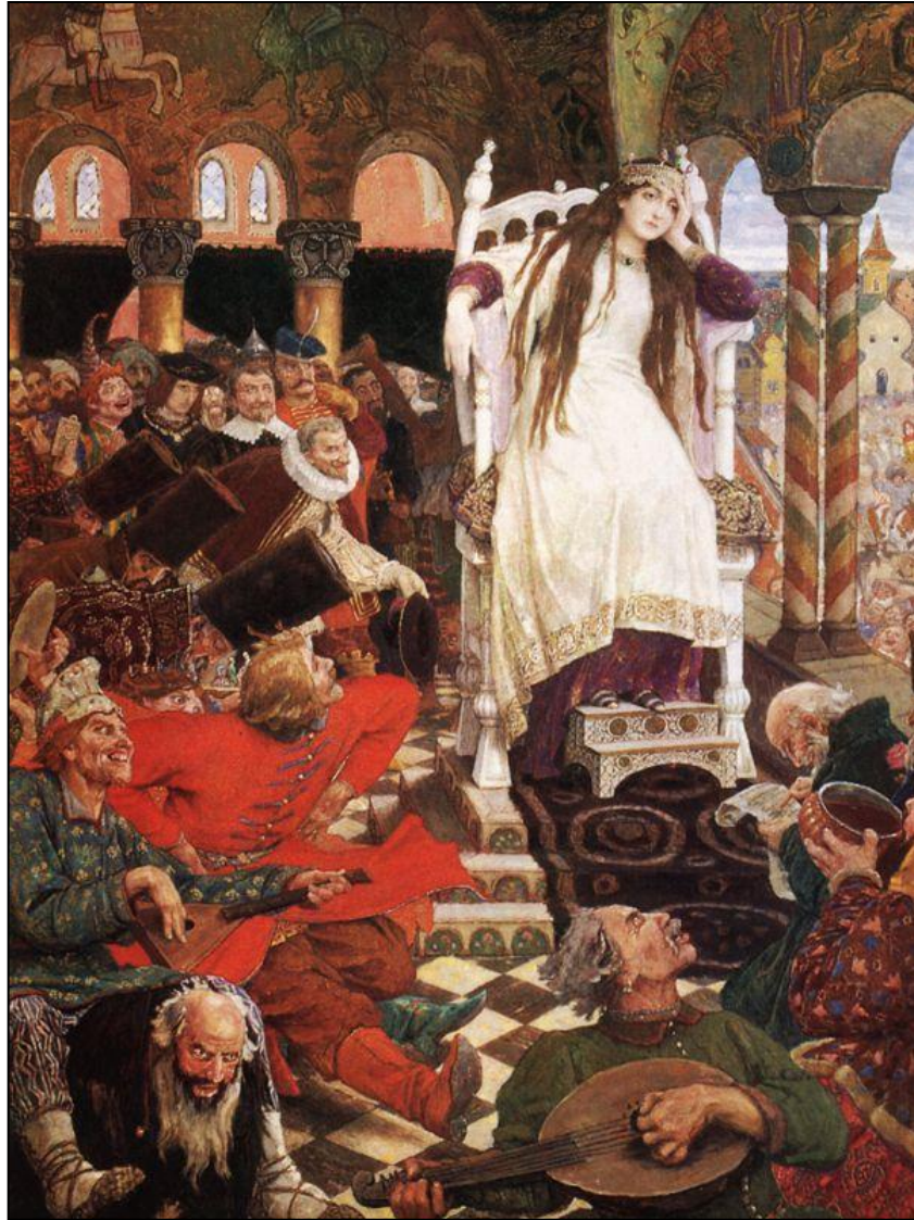
«Царевна-Несмеяна» (1916 – 1926, Дом-музей В. М. Васнецова в Москве)