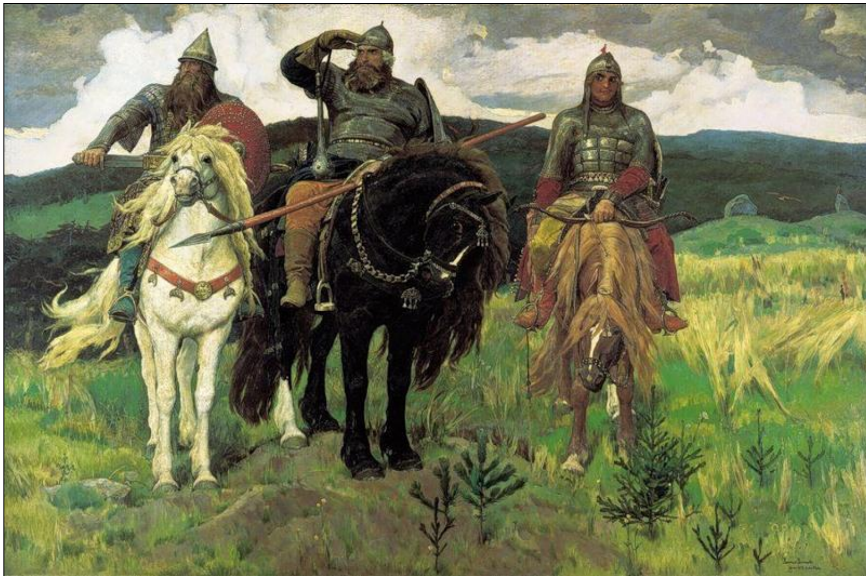
«Богатыри» (1898, ГТГ)