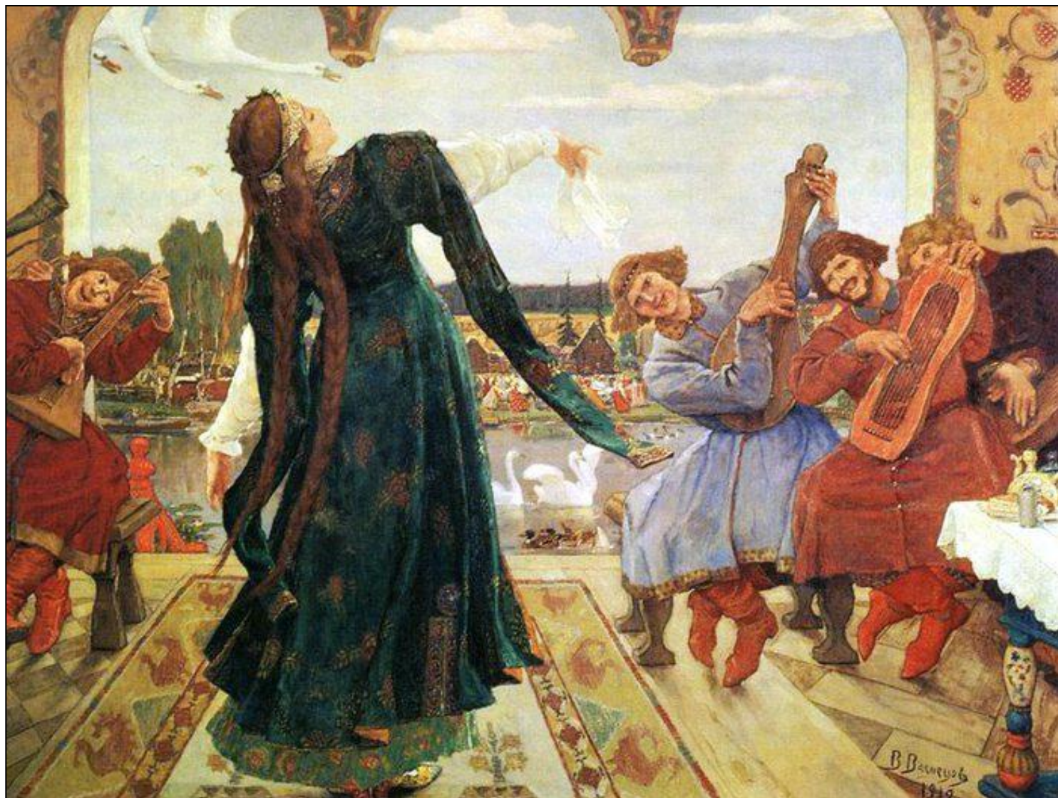
«Царевна-лягушка» (1918, Дом-музей В. М. Васнецова в Москве)