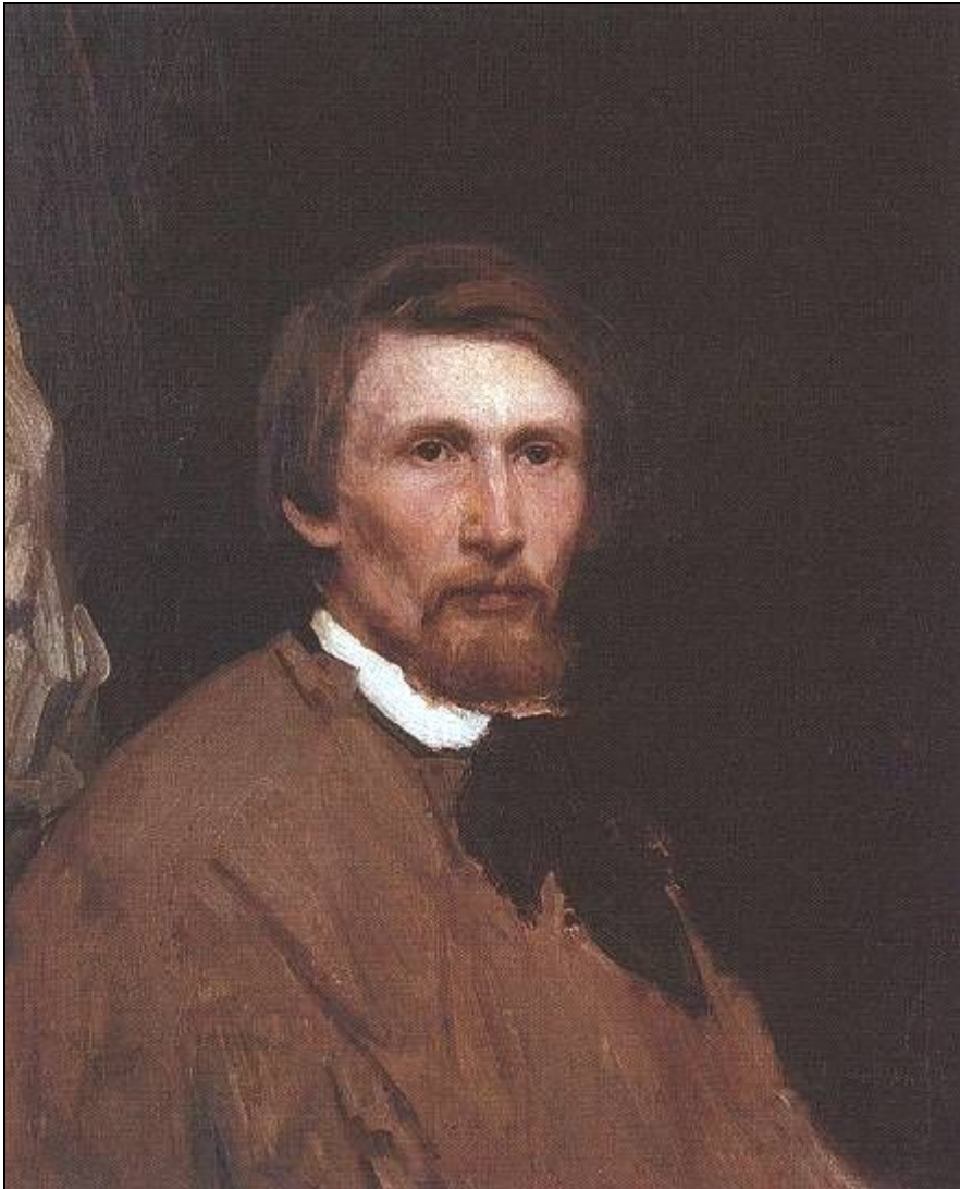
Автопортрет (1873, ГТГ)