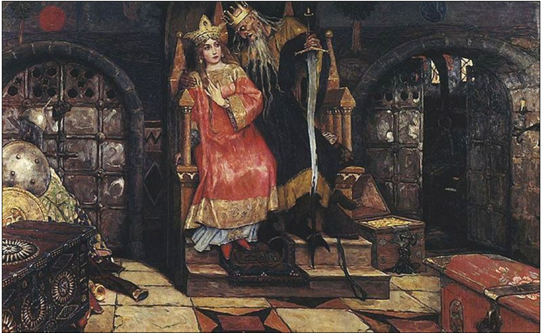
«Кощей Бессмертный» (1926 – 1927, Дом-музей В. М. Васнецова в Москве)