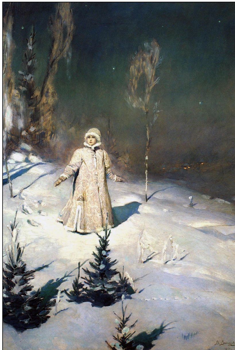
«Снегурочка» (1899, ГТГ)