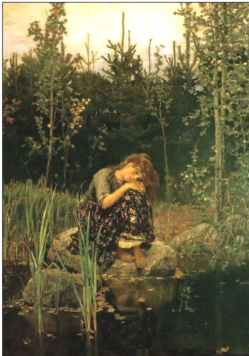
«Алёнушка» (1881, ГТГ)