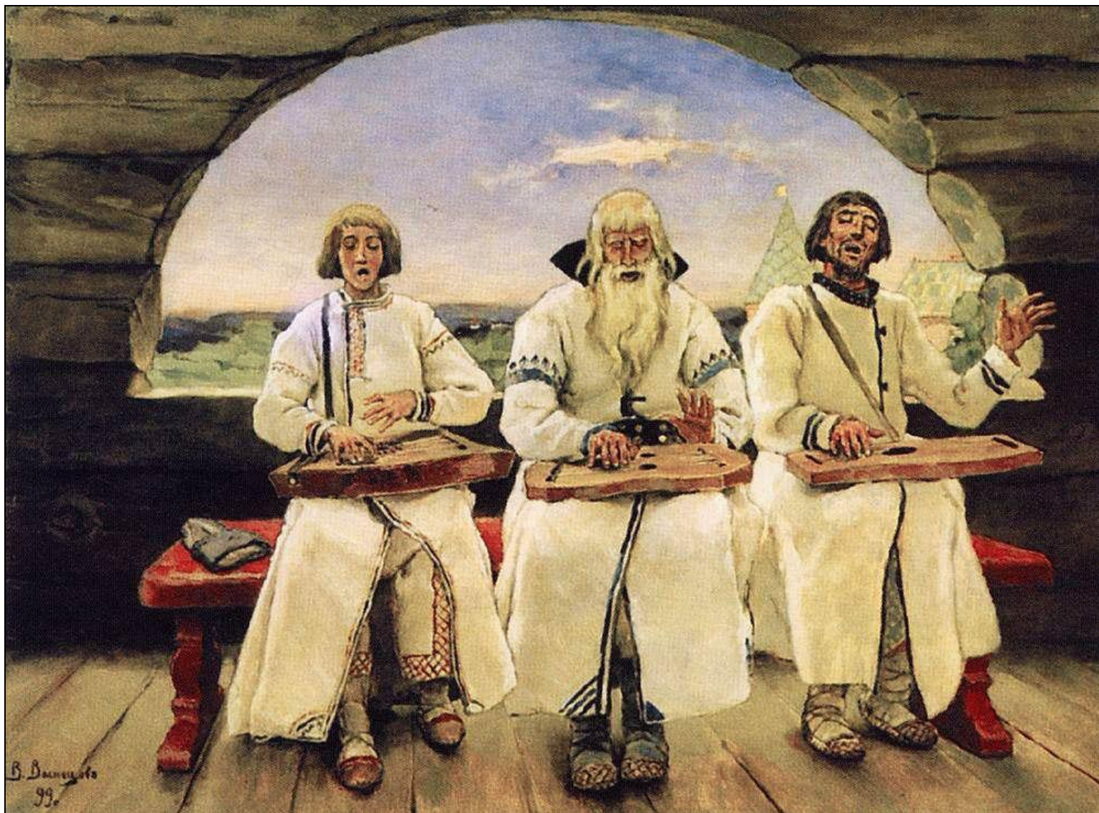
«Гусляры» (1899, Пермская государственная художественная галерея)