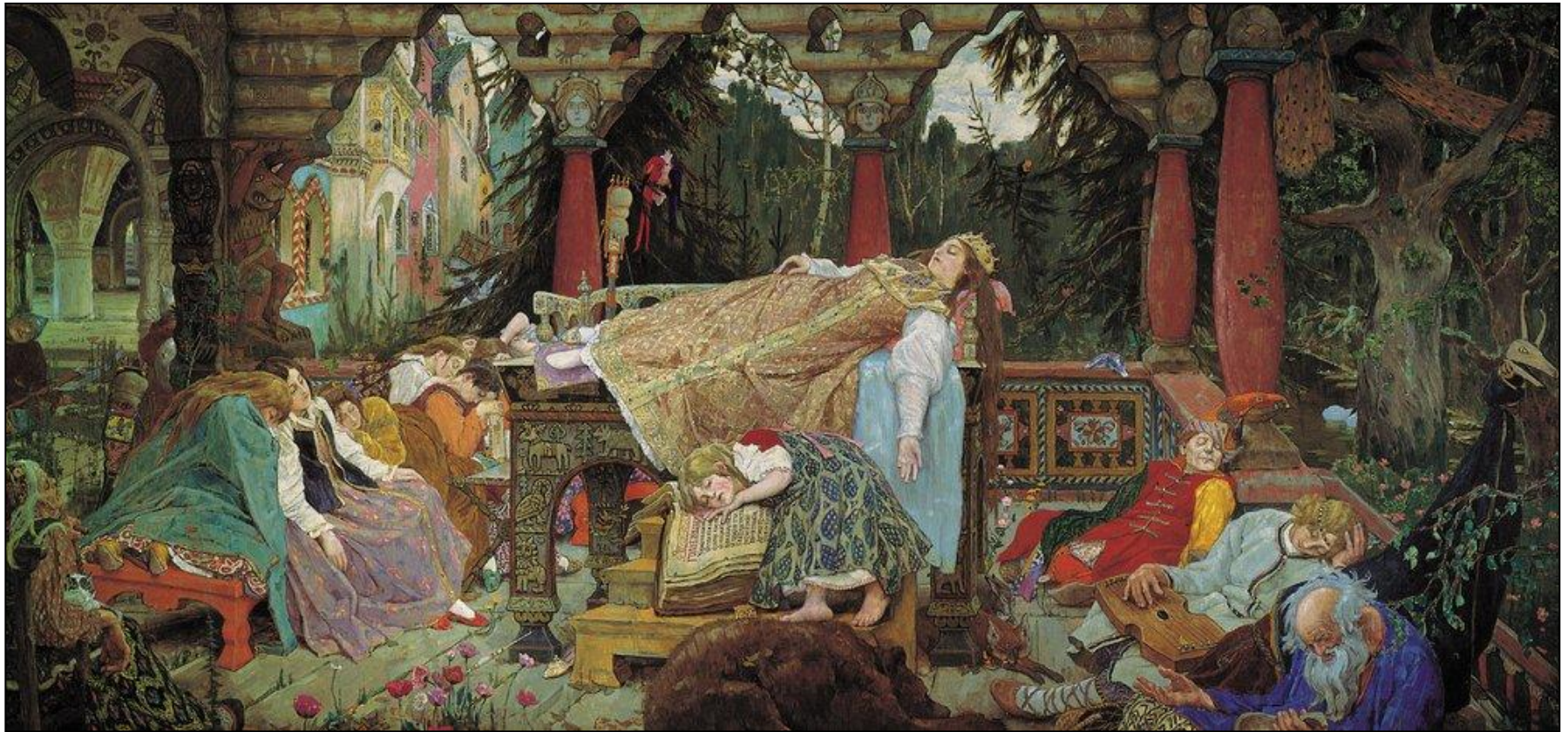
«Спящая царевна» (1926, Дом-музей В. М. Васнецова в Москве)