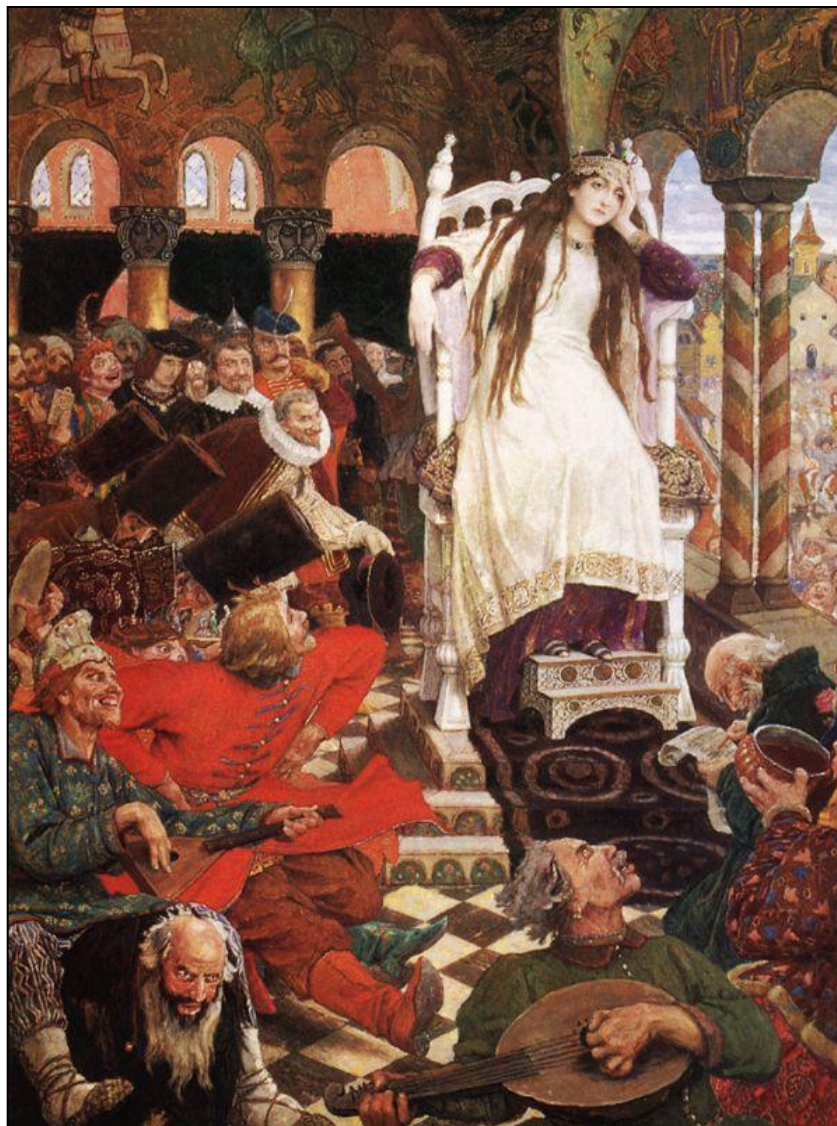
«Царевна-Несмеяна» (1916 – 1926, Дом-музей В. М. Васнецова в Москве)