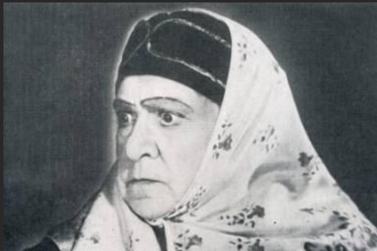
Кабаниха (В.Н. Пашенная)

Про нее говорят, что она — ханжа, “нищих оделяет, а домашних заела совсем”. Кабаниха постоянно упрекает всех вокруг за то, что они не проявляют к ней должной почтительности и уважения. Впрочем, и уважать ее совершенно не за что. Кабанова настолько донимает своих домочадцев, что они тихо ненавидят ее. Иначе к ней относиться просто нельзя.