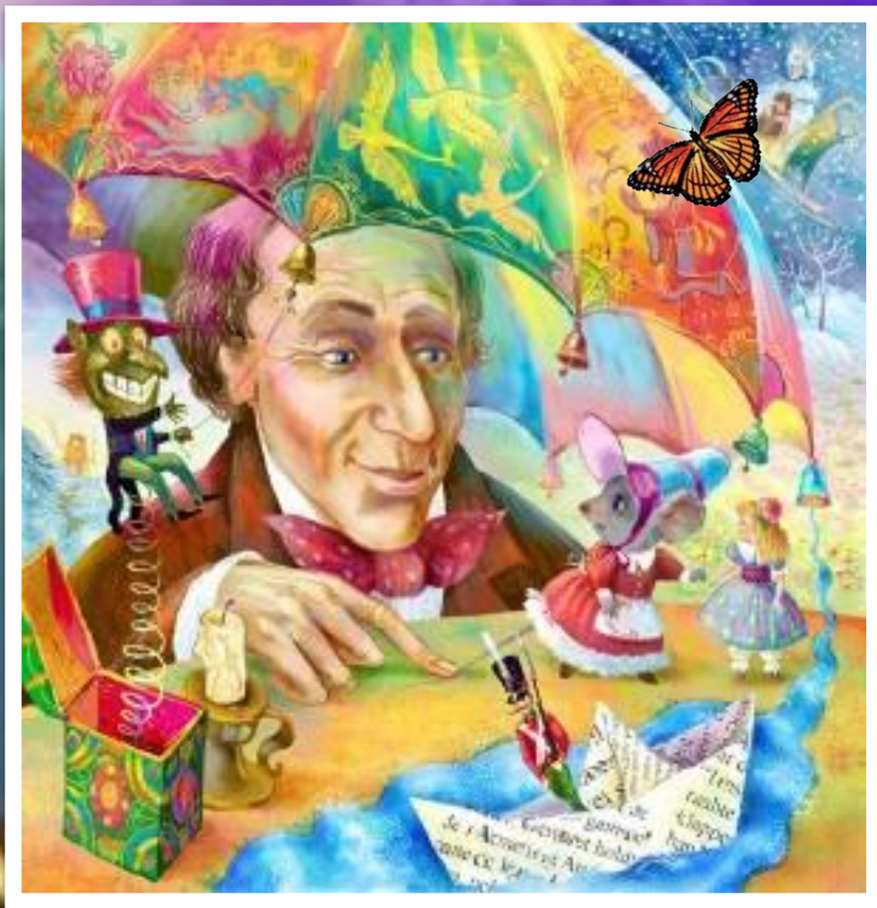
Ганс Христиан Андерсен