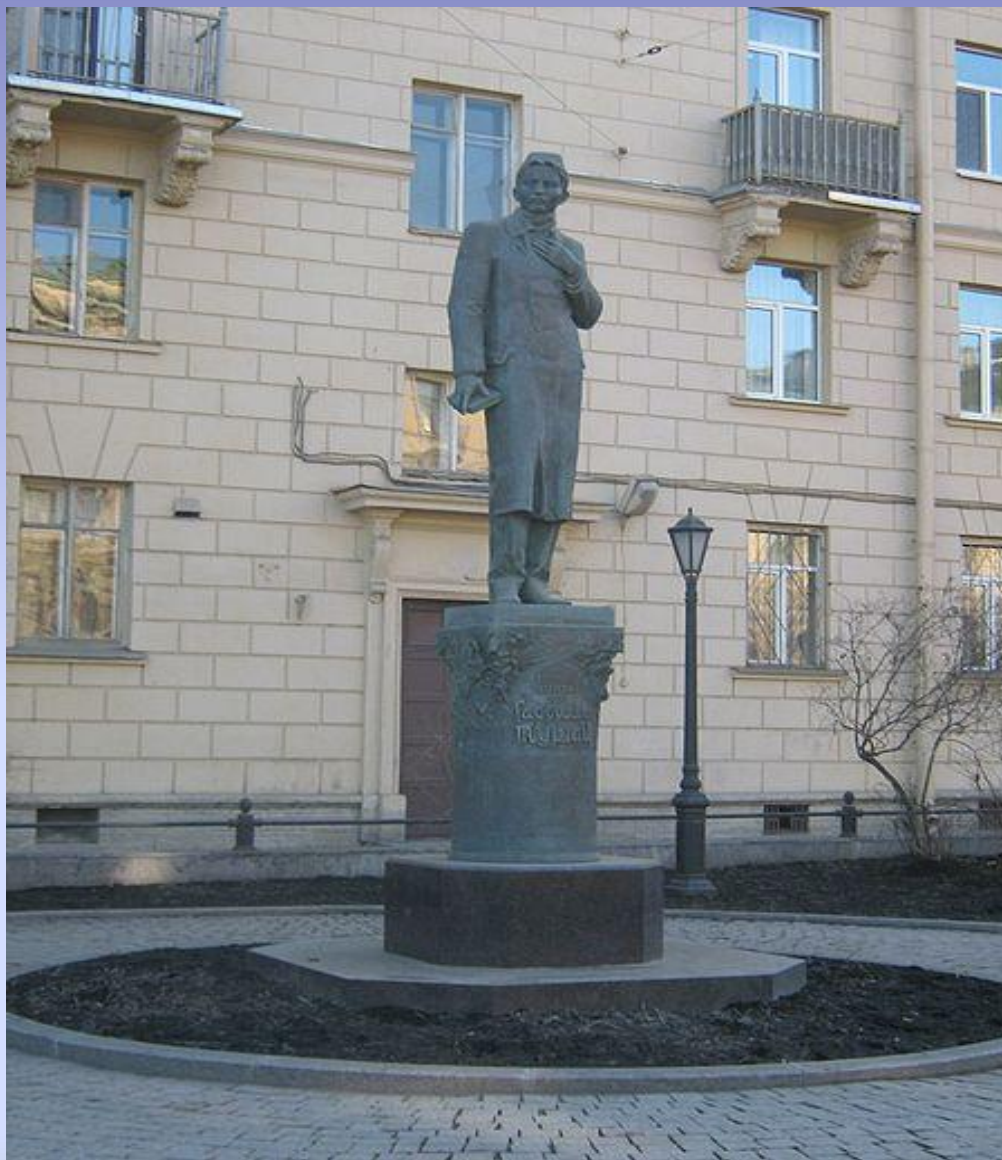
Памятник Тугаю в Санкт-Петербурге