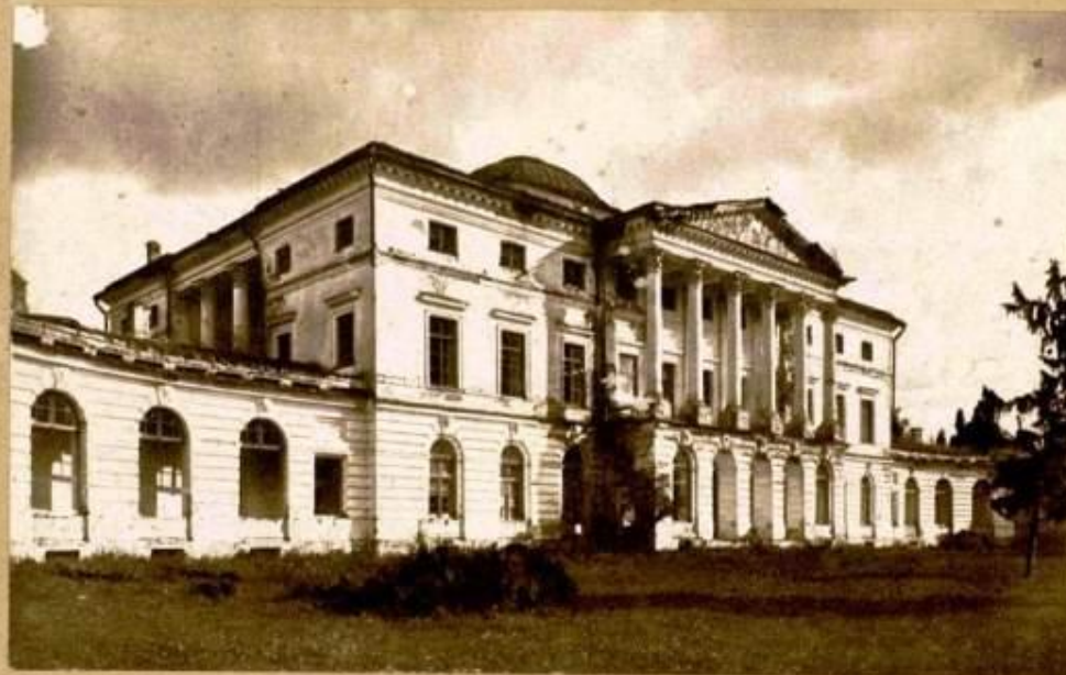
Имение Красный Рог