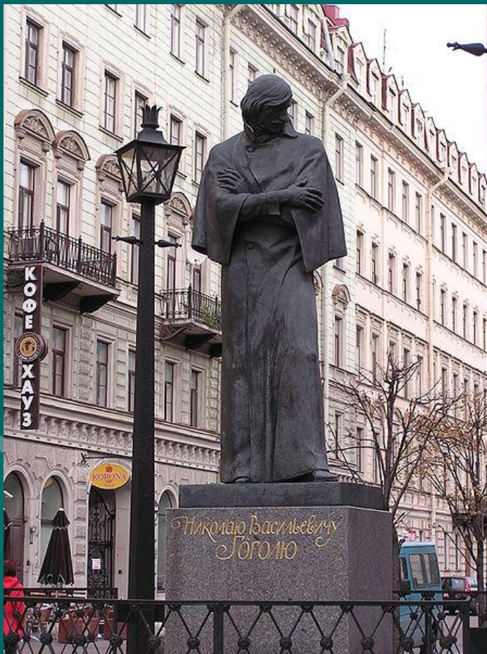
Памятник Н.В. Гоголю в Петербурге

Молчи! Молчи, мой черный Гоголь! Спины тебе не разогнуть! Смеялся ты и плакал много ль, Российский измеряя путь?