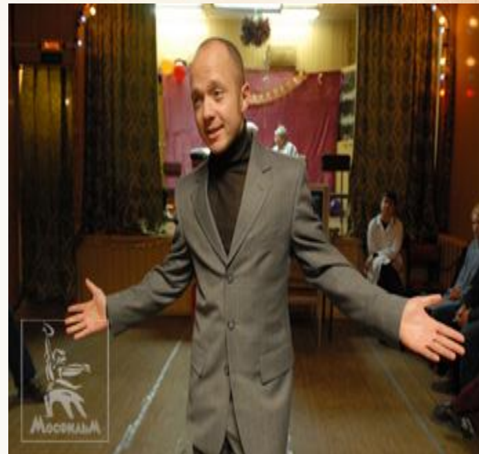
Евгений Стычкин в роли Хоботова.