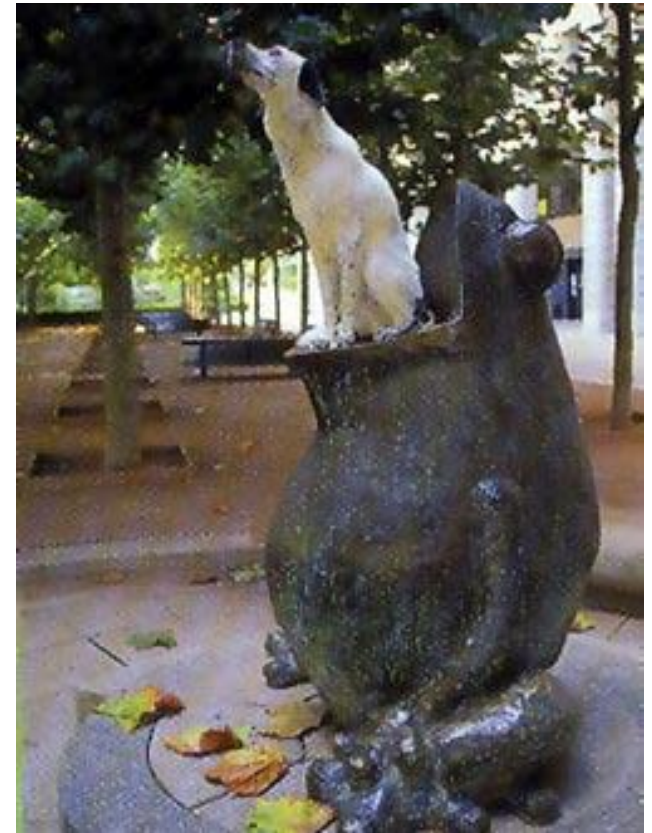
Памятник лягушке возле здания Института Пастера в Париже.