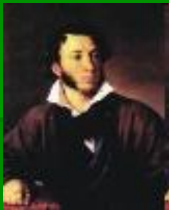
А.С. Пушкин (1799-1837)

Россия феодальная крепостническая страна