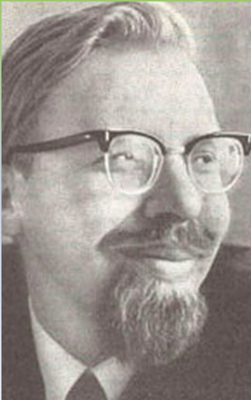
Геннадий Михайлович Цыферов (1930 - 1972)