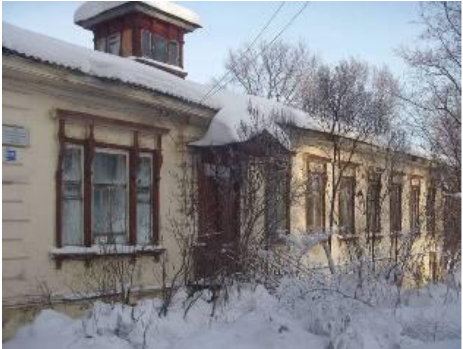
Дом детства Е. И. Чарушина