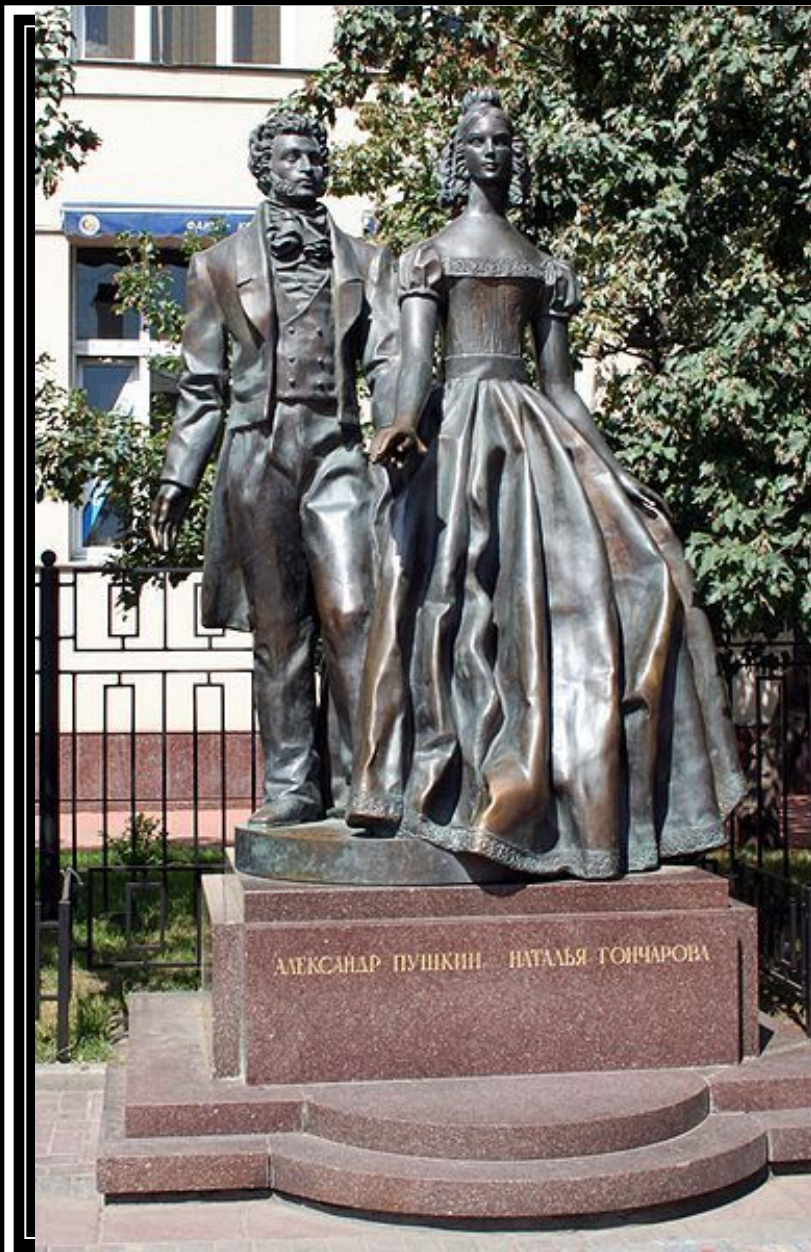
Памятник Пушкину и Гончаровой на Арбате. Скульптор — А. Н. Бурганов