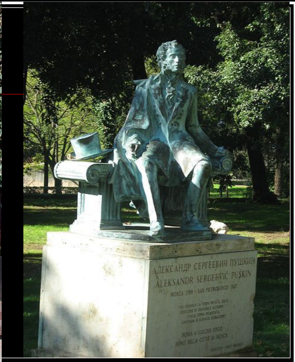
Памятник Пушкину в Риме (скульптор Ю. Орехов )