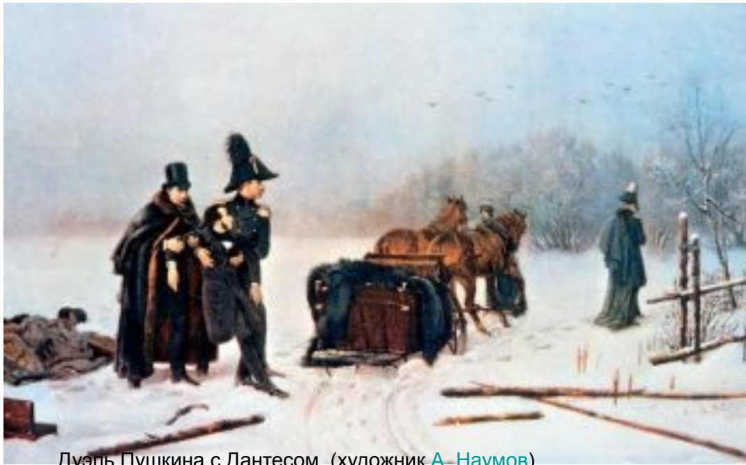
Дуэль Пушкина с Дантесом. (художник А. Наумов )