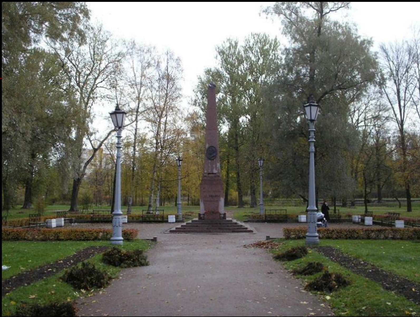
Обелиск на месте дуэли Пушкина. ст.м. Черная речка, Санкт-Петербург.