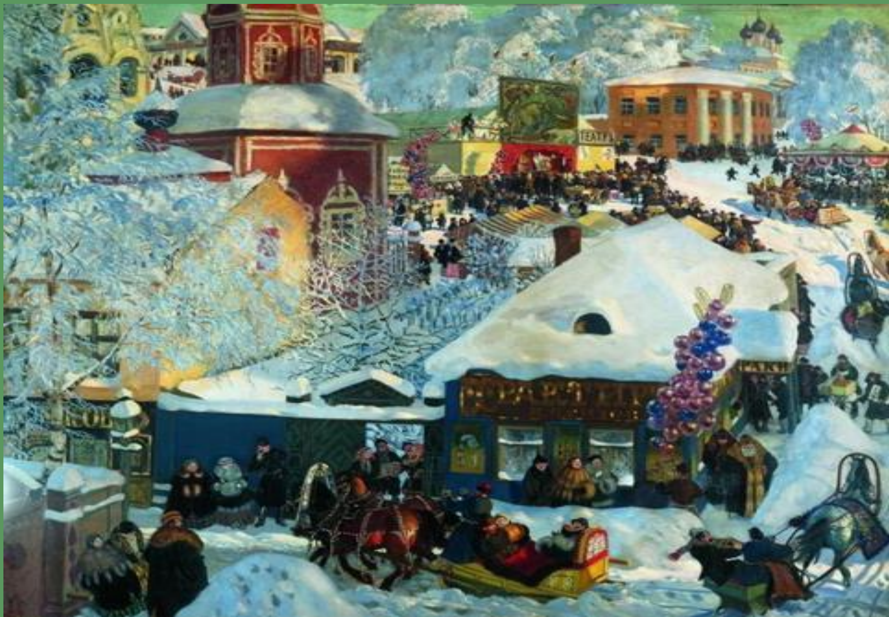
Б.Кустодиев. Масленичное гулянье. 1919 г.