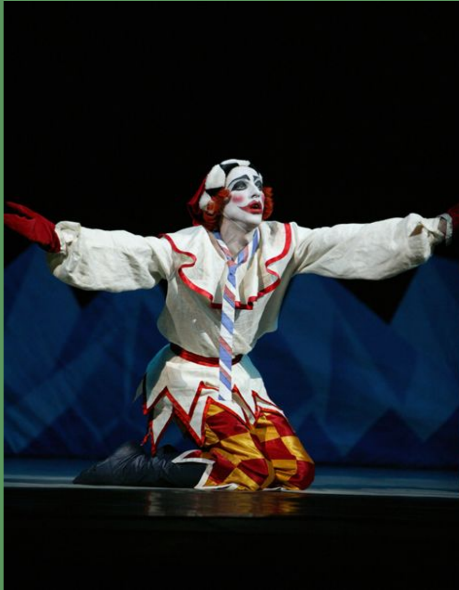
И.Стравинский балет «Петрушка»