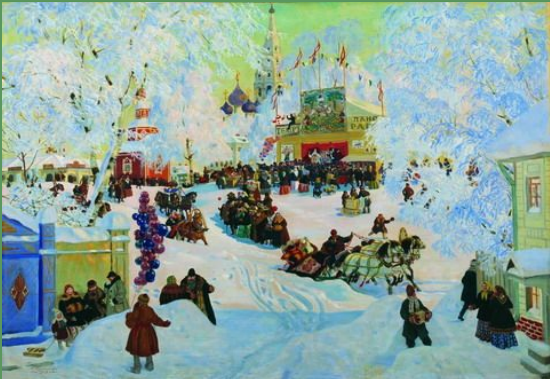
Б.Кустодиев. Масленица. 1919 г.