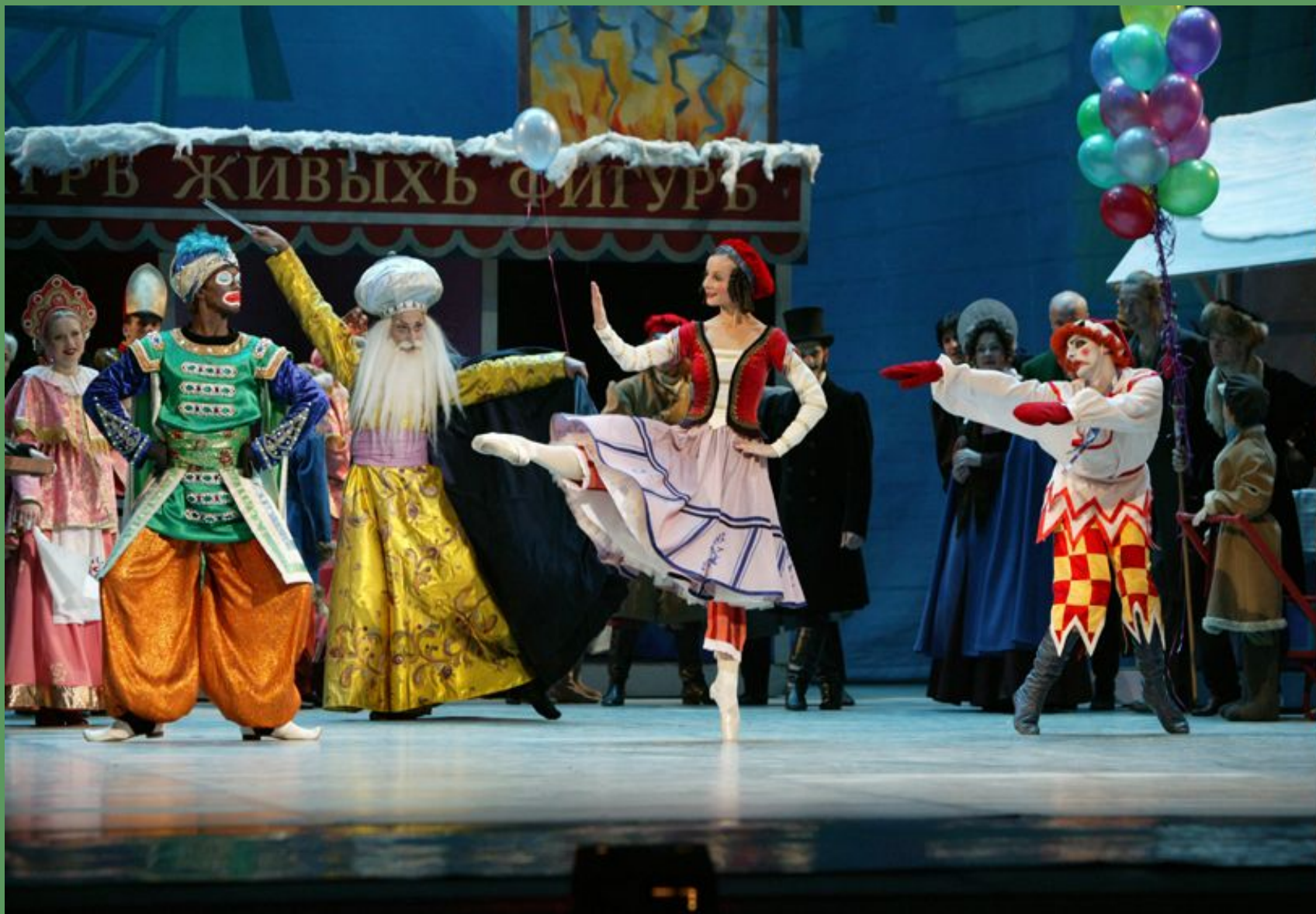
И.Стравинский балет «Петрушка»