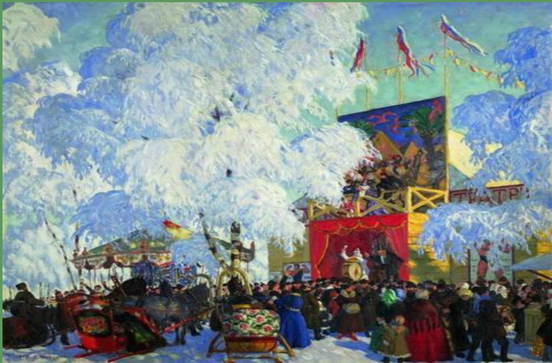
Б.Кустодиев. Балаганы. 1917 г.