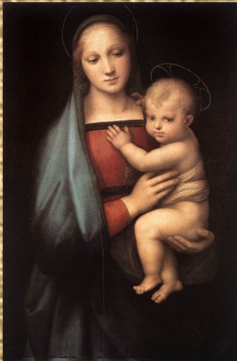
Рафаэль. Мадонна Грандука.

Она с величием, он с разумом в очах - Взирали, кроткие, во славе и в лучах, Одни, без ангелов, под пальмою Сиона.