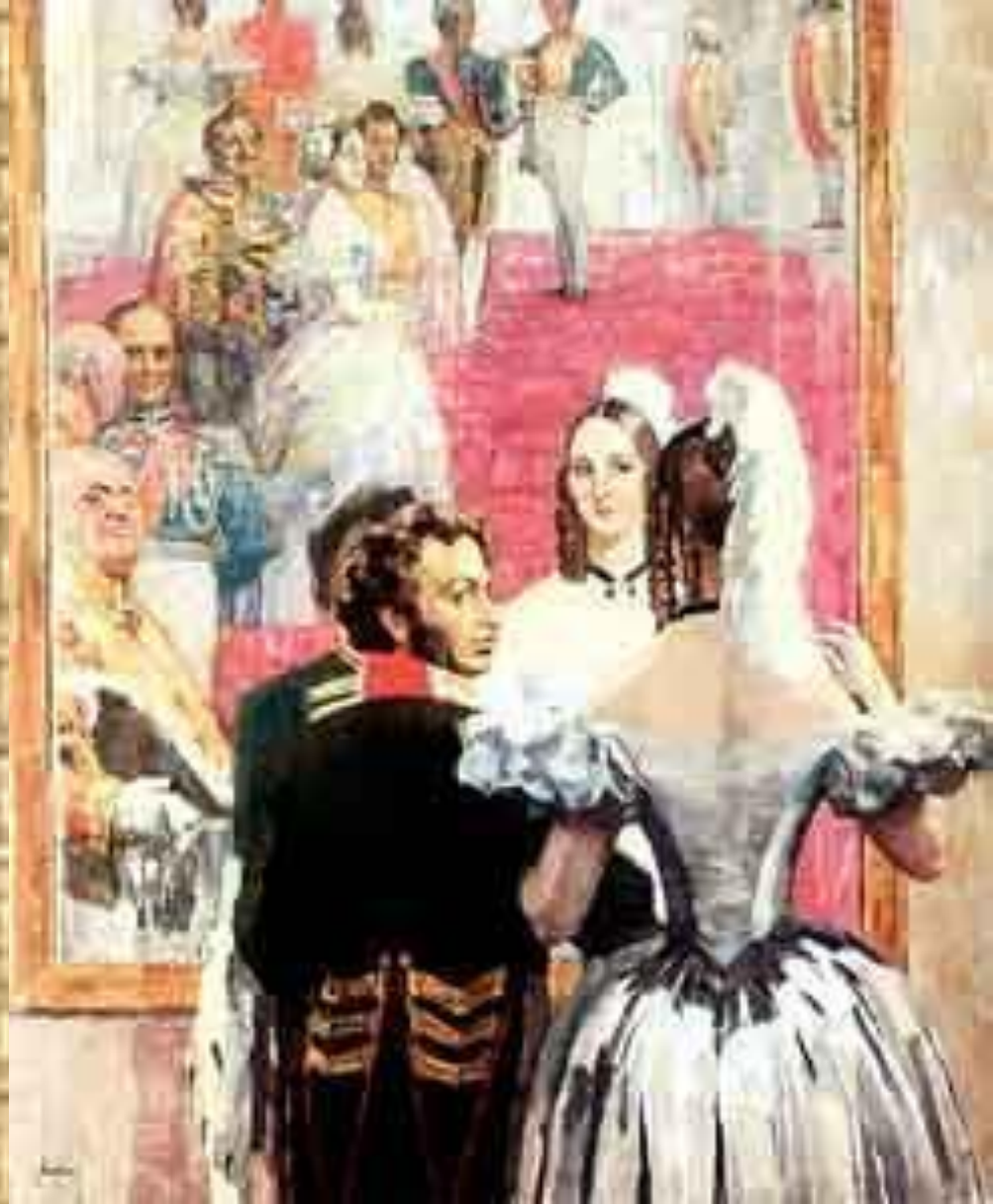
Н. П. Ульянов. Пушкин с женой перед зеркалом на придворном балу. 1936 г.

Вечное безденежье, унизительное, двусмысленное положение: младший придворный чин камер- юнкера и обязанность жить в Петербурге и являться на придворные балы с красавицей женой, невозможность выйти в отставку, что лишало бы поэта возможности работать в исторических архивах.