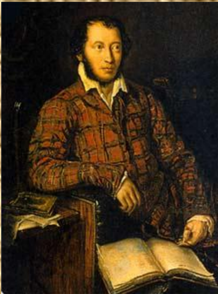
А.С.Пушкин. Портрет работы К.П.Мазера. 1839 год.

Пушкину свойственно удивительно мудрое отношение к жизни: поэт принимает жизнь с ее горестями и невзгодами, во всей ее сложности.