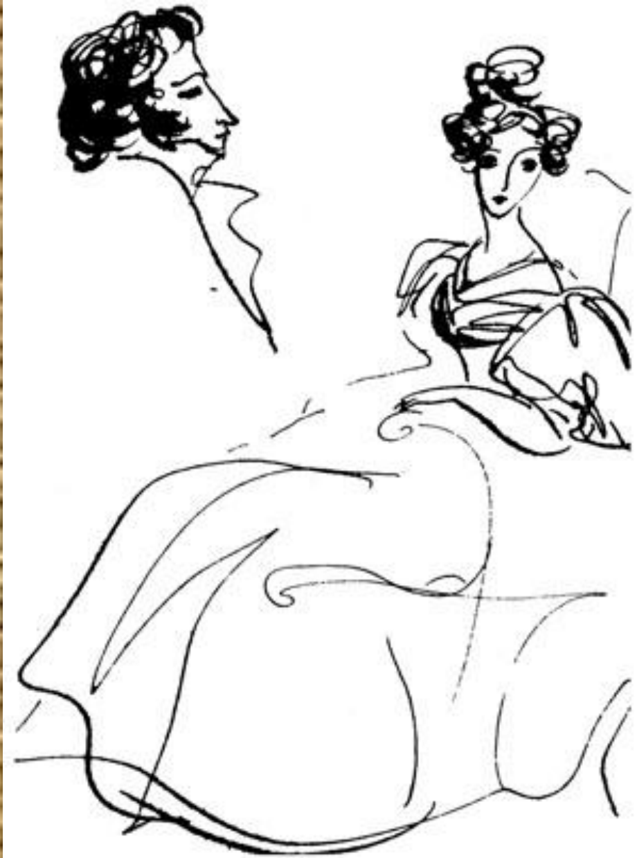
Н. Рушева «Пушкин и Керн»

Женская красота для Пушкина – источник жизни, вдохновения, наслаждения.