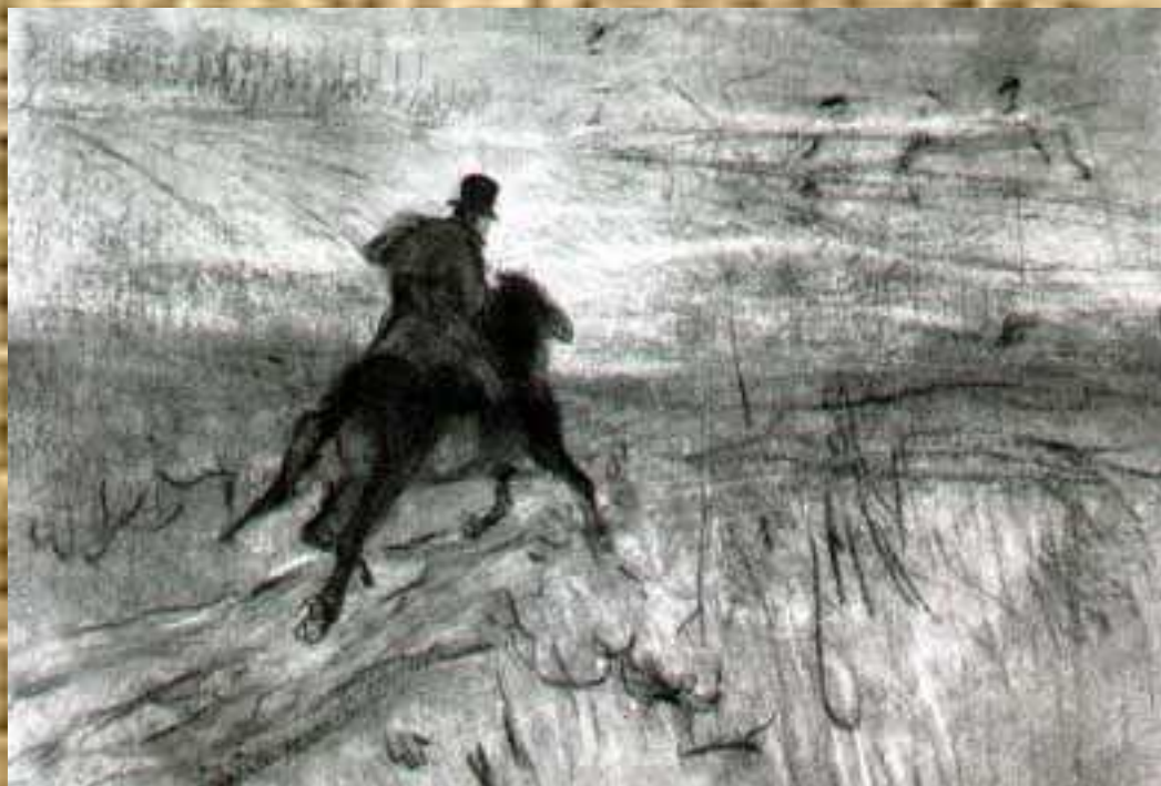
Пушкин на прогулке. Художник В.А. Серов. 1899 год

Уединение мое совершенно», - пишет Пушкин в декабре 1824 года.