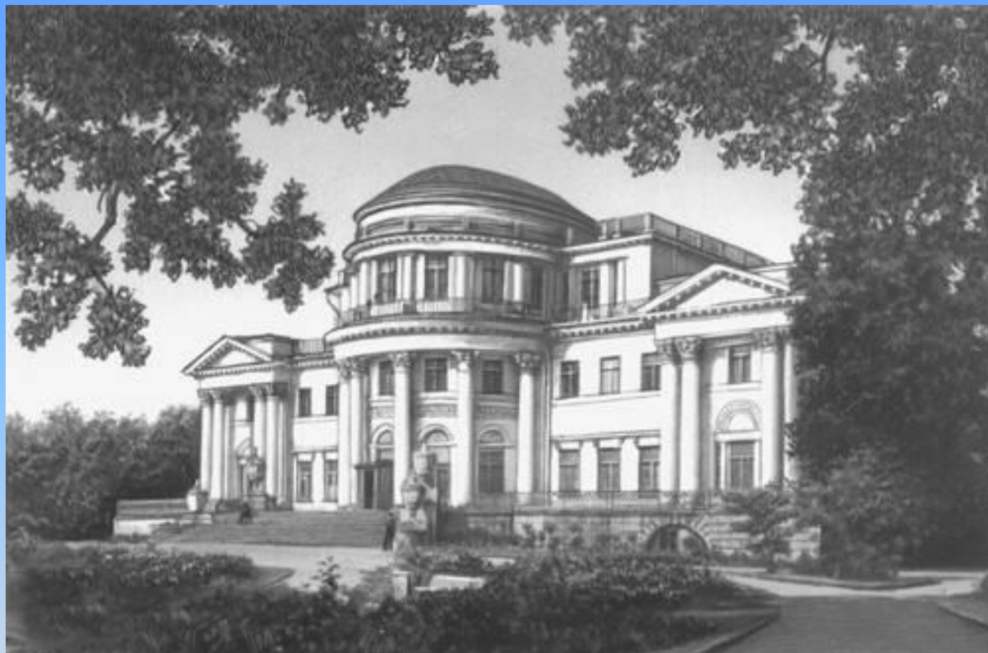
Питер. Елагин дворец.