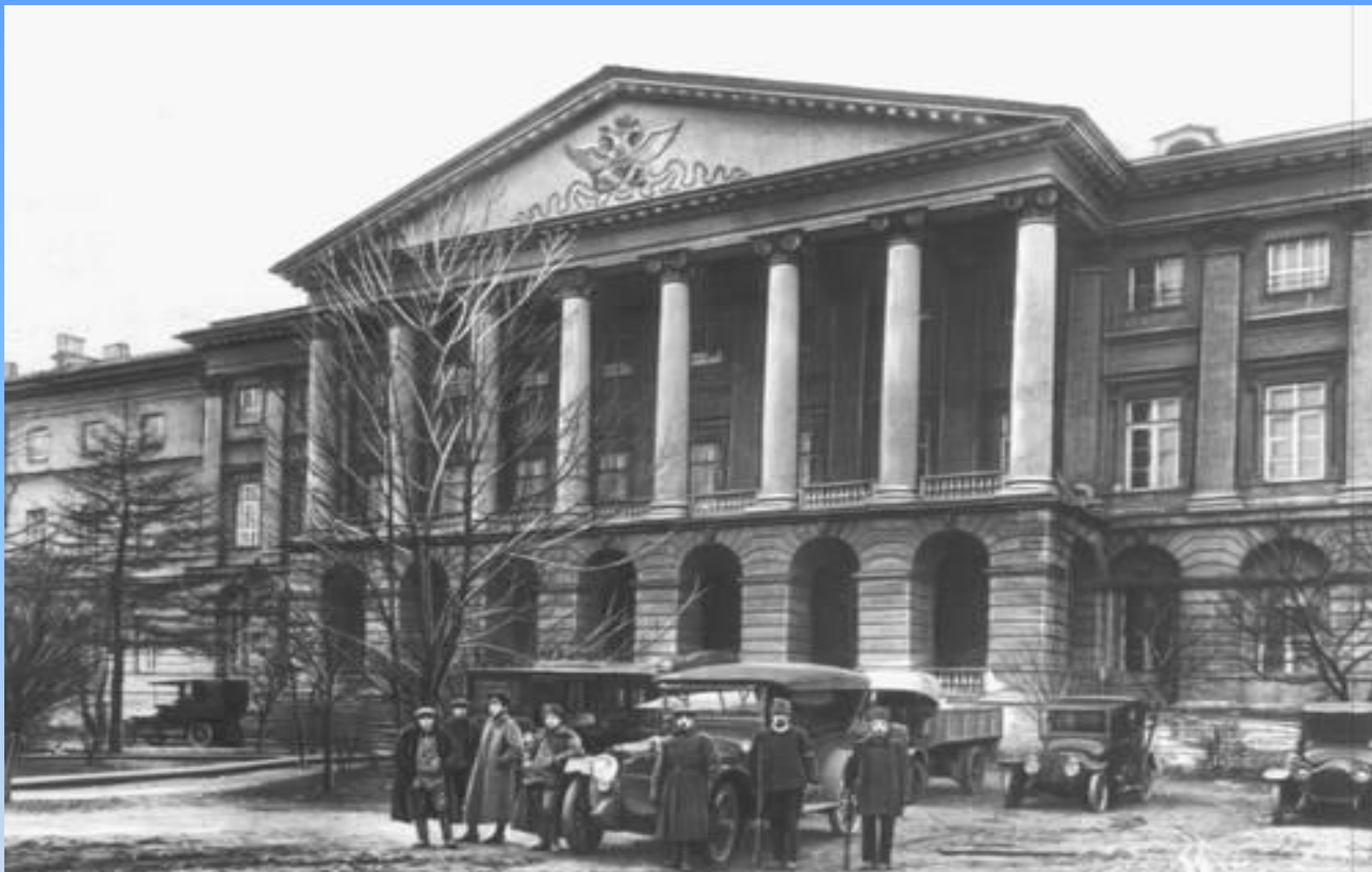
Питер. Смольный (1917).