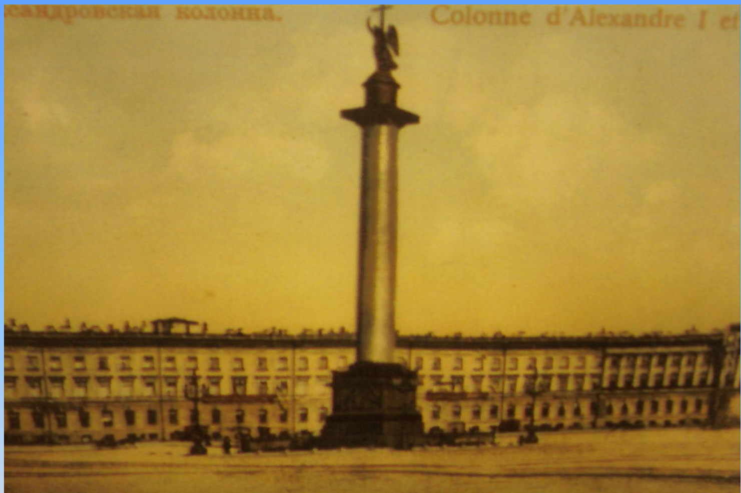
Санкт-Петербург. Александровская колонна.