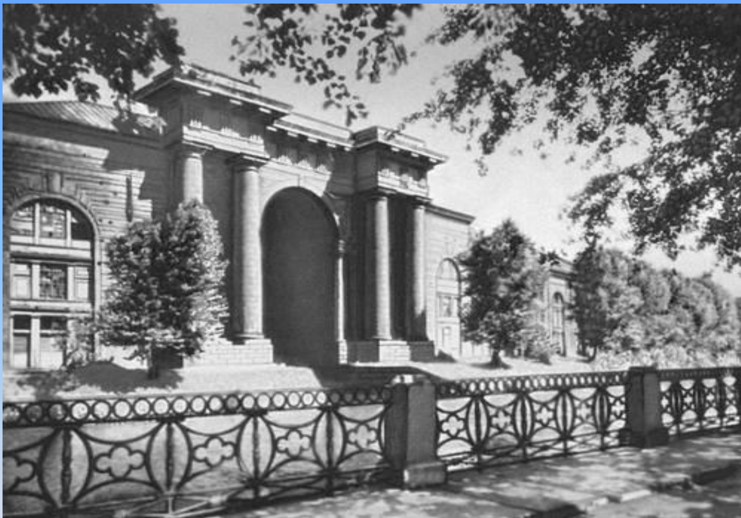
Питер. Склады «Новая Голландия»