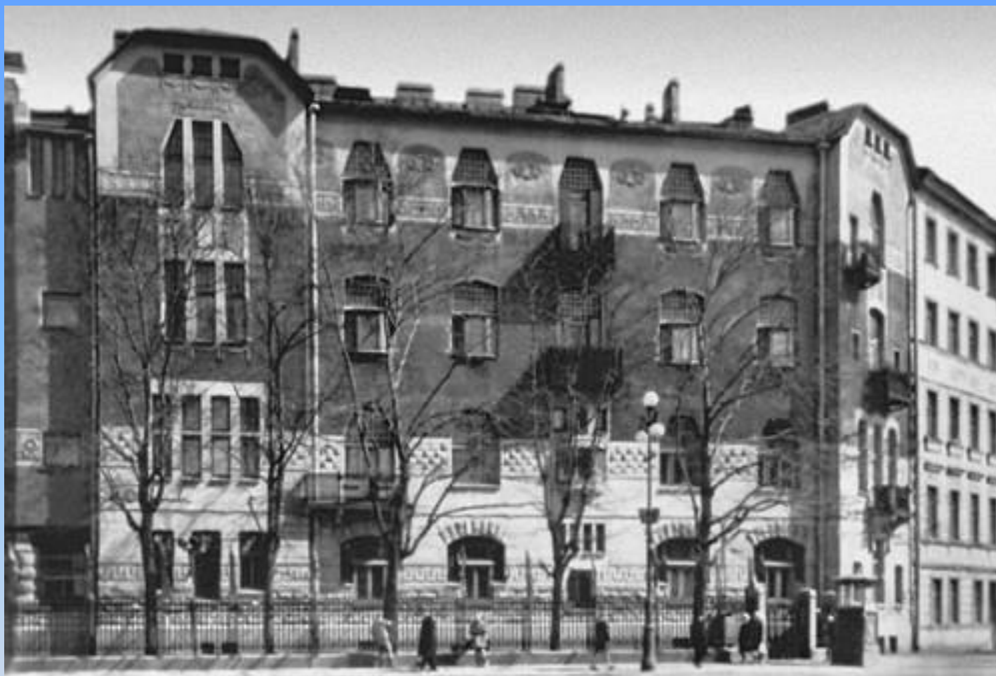
Петербург. Доходный дом.