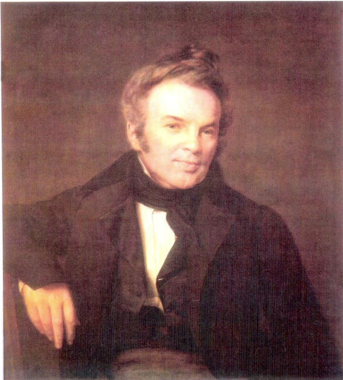
И.И. Лажечников. 1834 г. Художник А.В. Тыранов. Всероссийский музей А.С. Пушкина