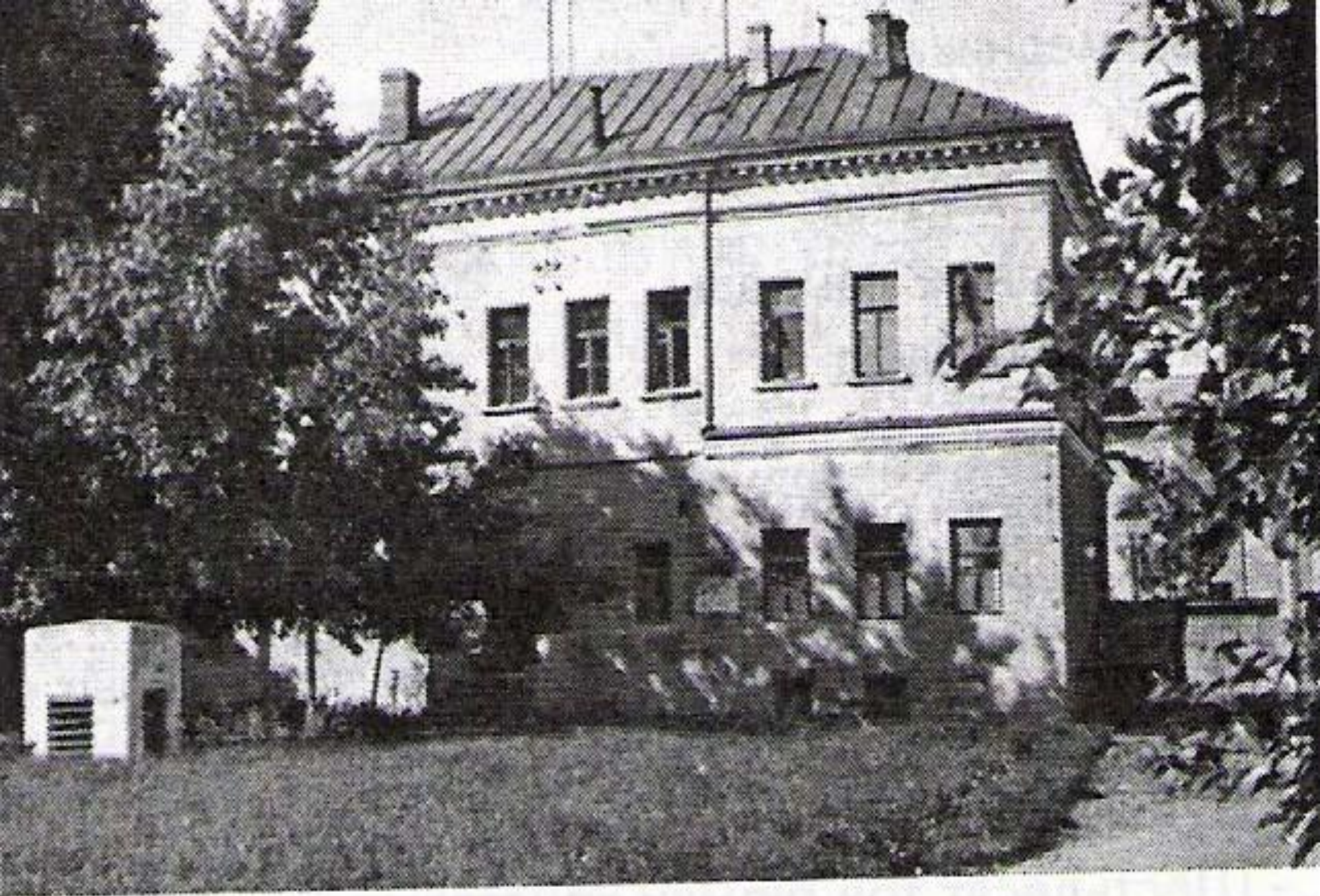
Главный дом усадьбы. 1960-е гг.