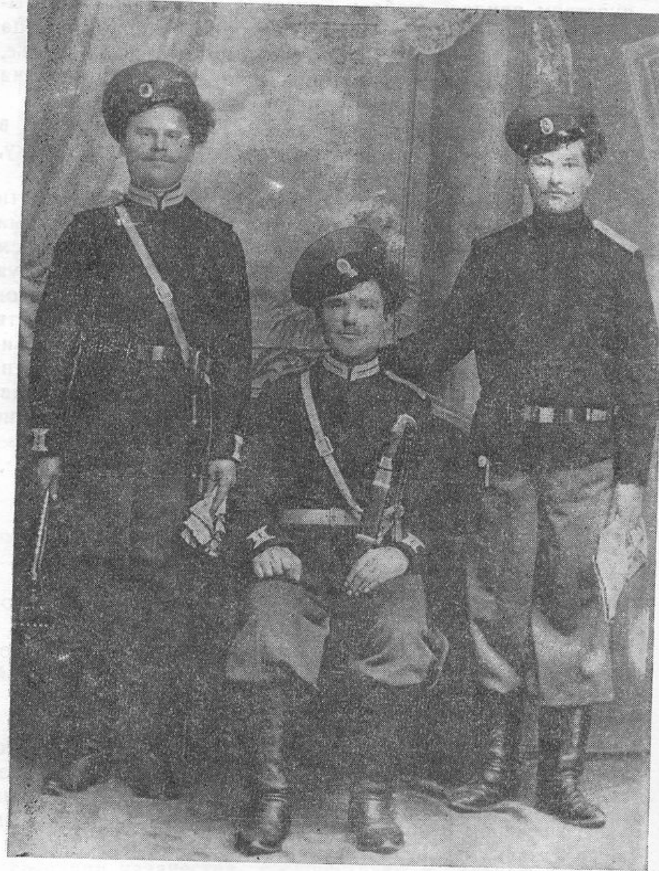
Эти донские казаки сфотографировались перед отправкой на действительную службу в канун первой мировой войны.