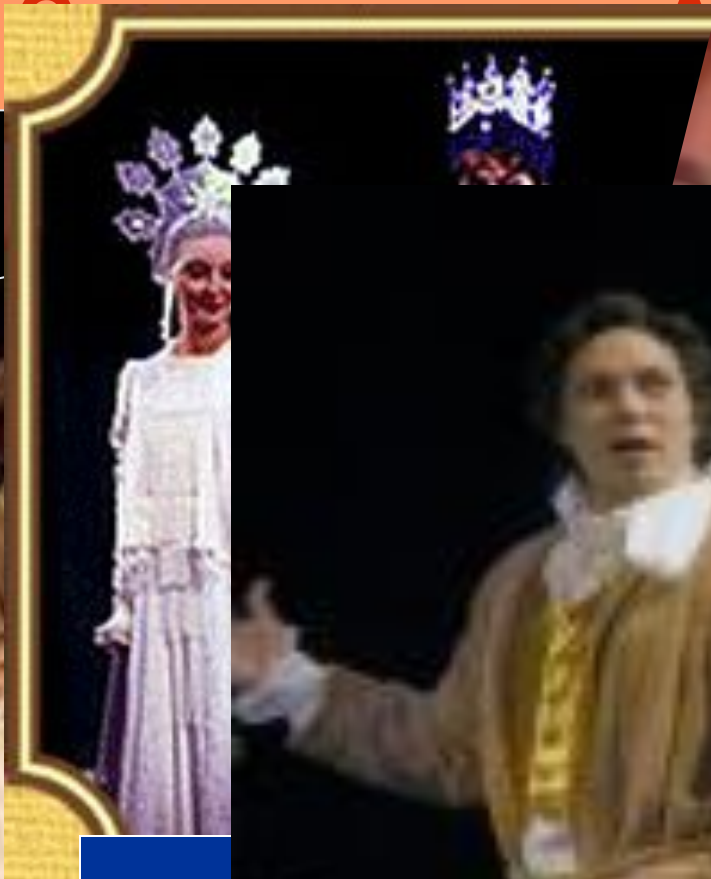
Сцена из др