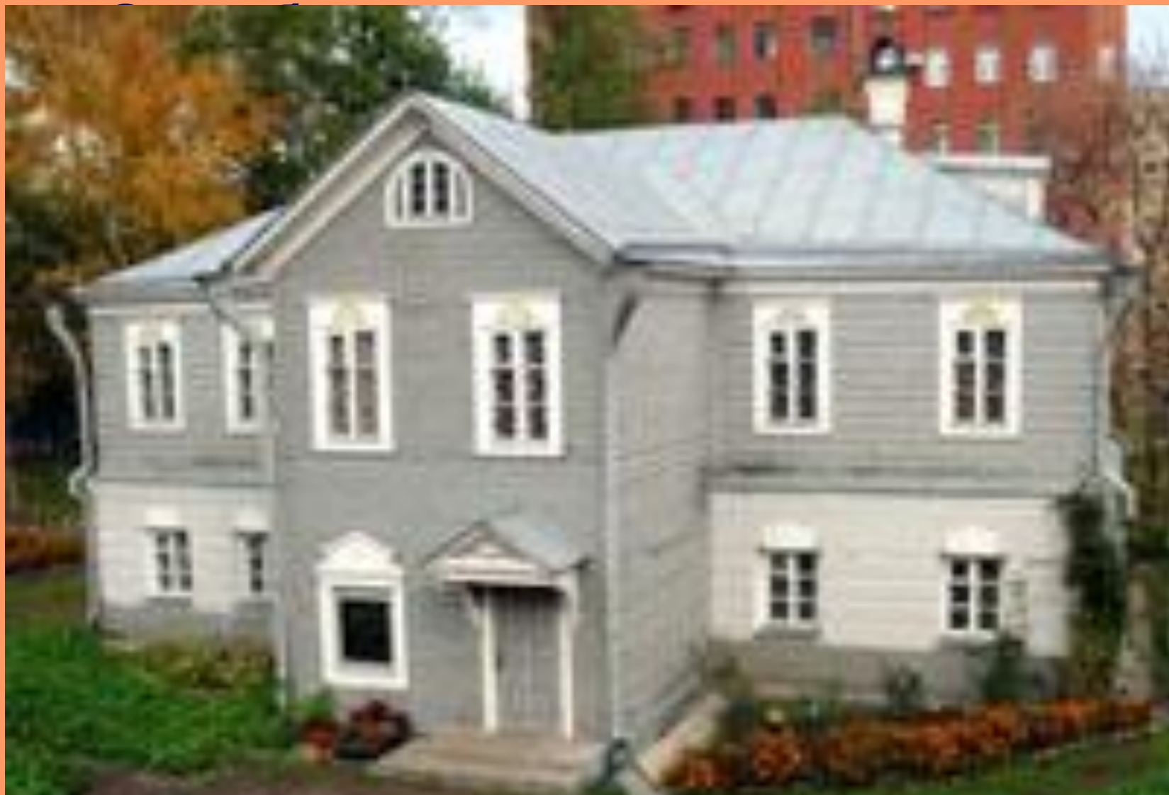
Дом-музей А.Н.Островского в Замоскворечье