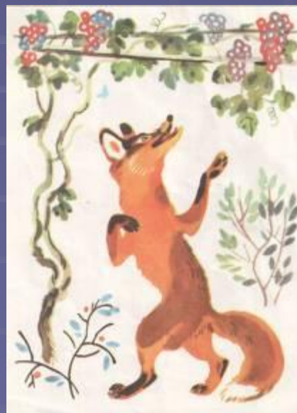
Лисица и виноград