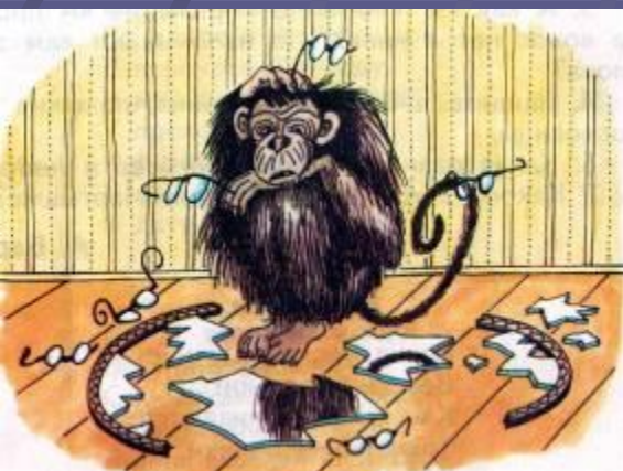
Мартышка и очки