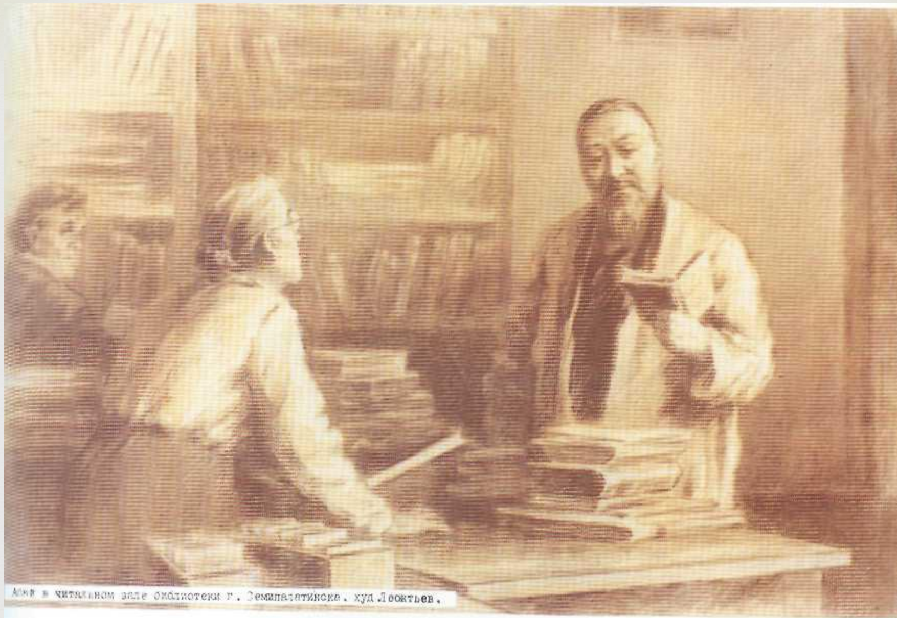
Абай Кунанбаев в Семипалатинской библиотеке