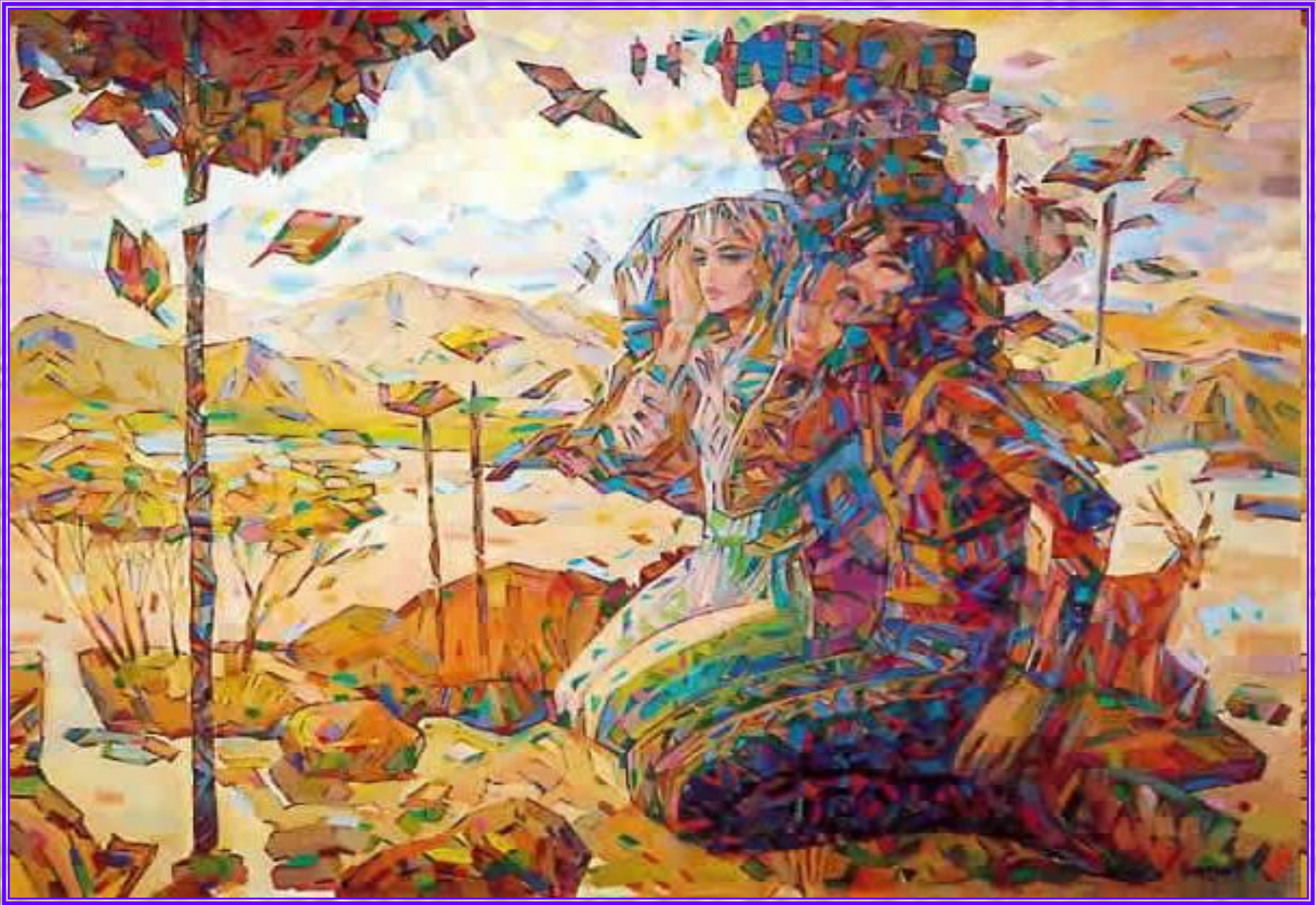
«ЭХО». Мир многогранен, полон разных звуков и