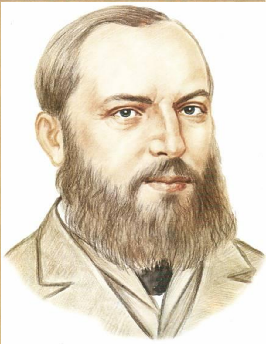
Фет Афанасий Афанасьевич (1820-1892)