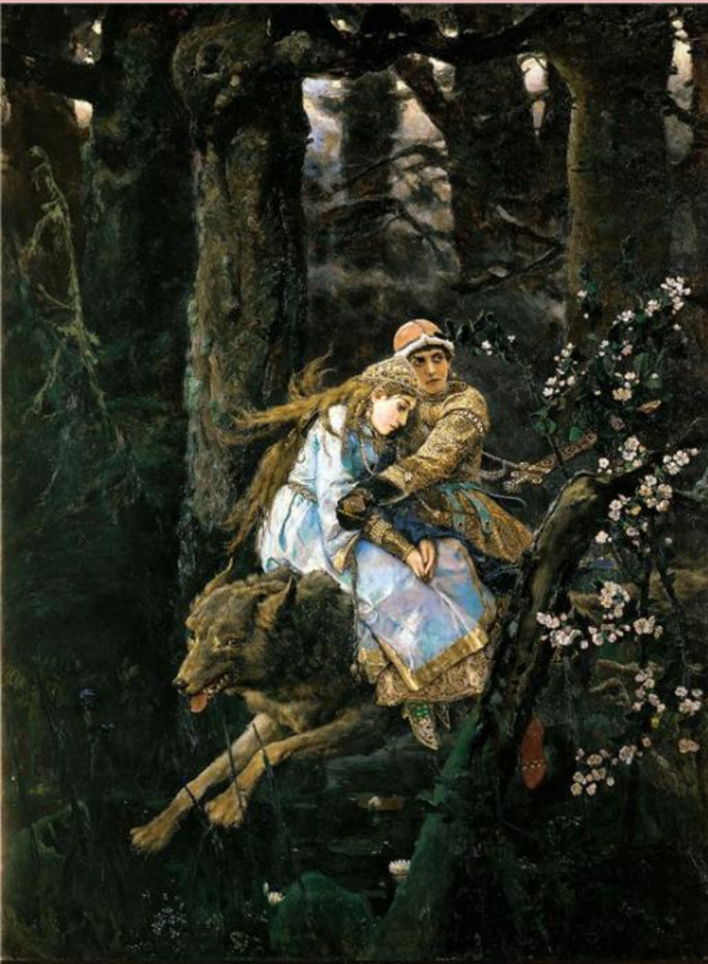
"Иван Царевич на сером волке" Дата: 1889 г.