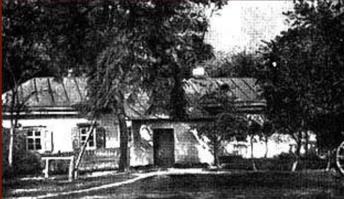
Дом доктора М.Я.Трохимовского в Сорочинцах, где родился Гоголь