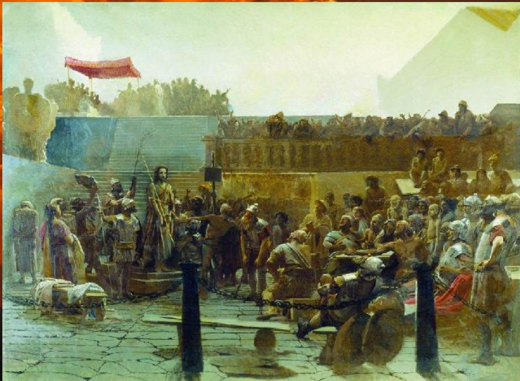
И. Н. Крамской «Хохот»