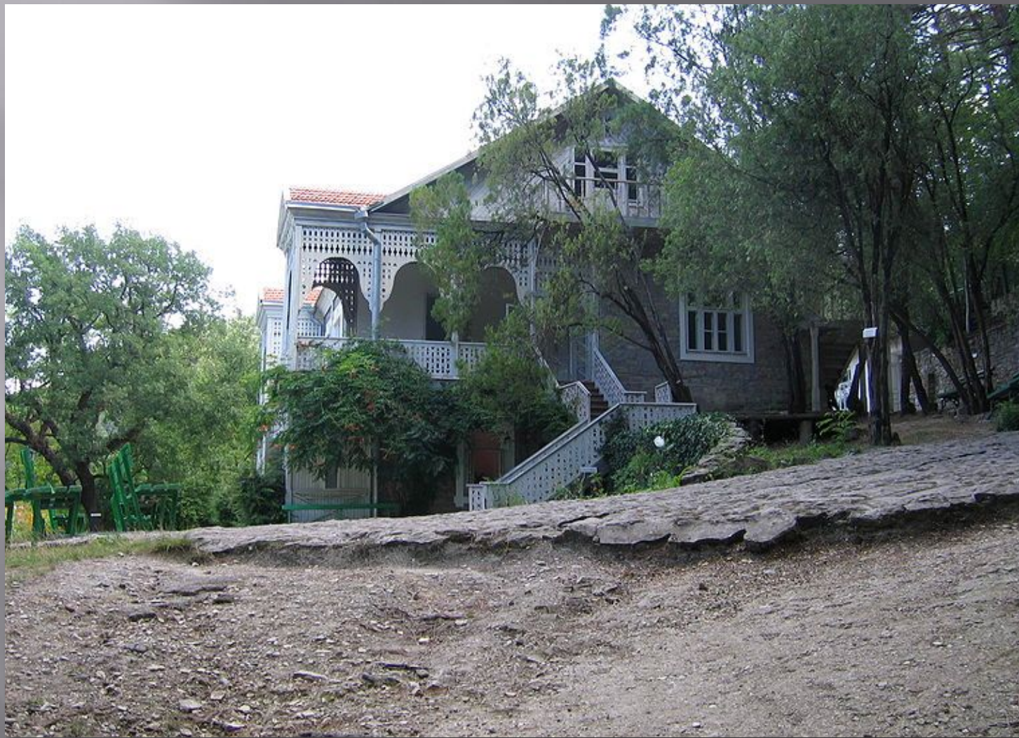
Вид на дачу от входа в музей