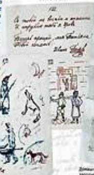
Детские записки, Молодой Блок в 1897 г.