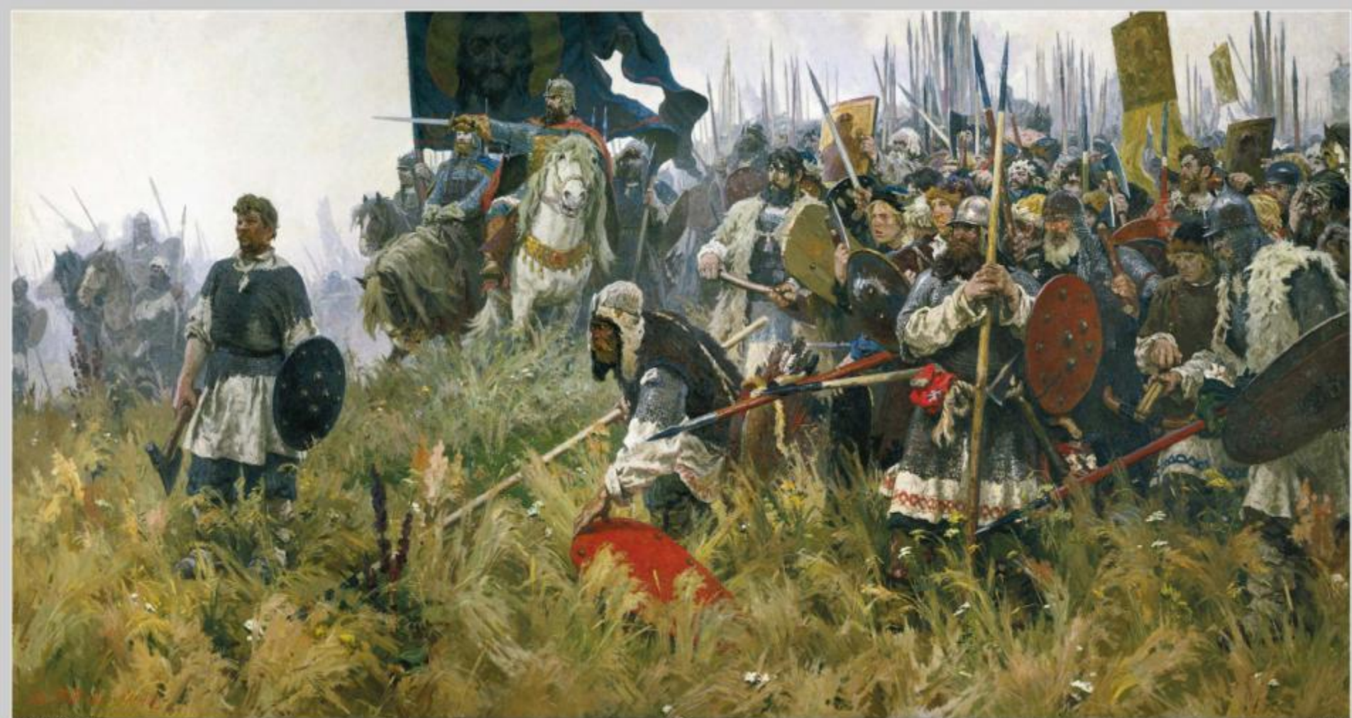
А. Бубнов. Утро на Куликовом поле.

«Куликовская битва принадлежит... к символическим событиям русской истории. Таким событиям суждено возвращение. Разгадка их еще впереди». (А. Блок)