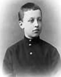
Блок - ребенок в детстве. Февраль 1890.