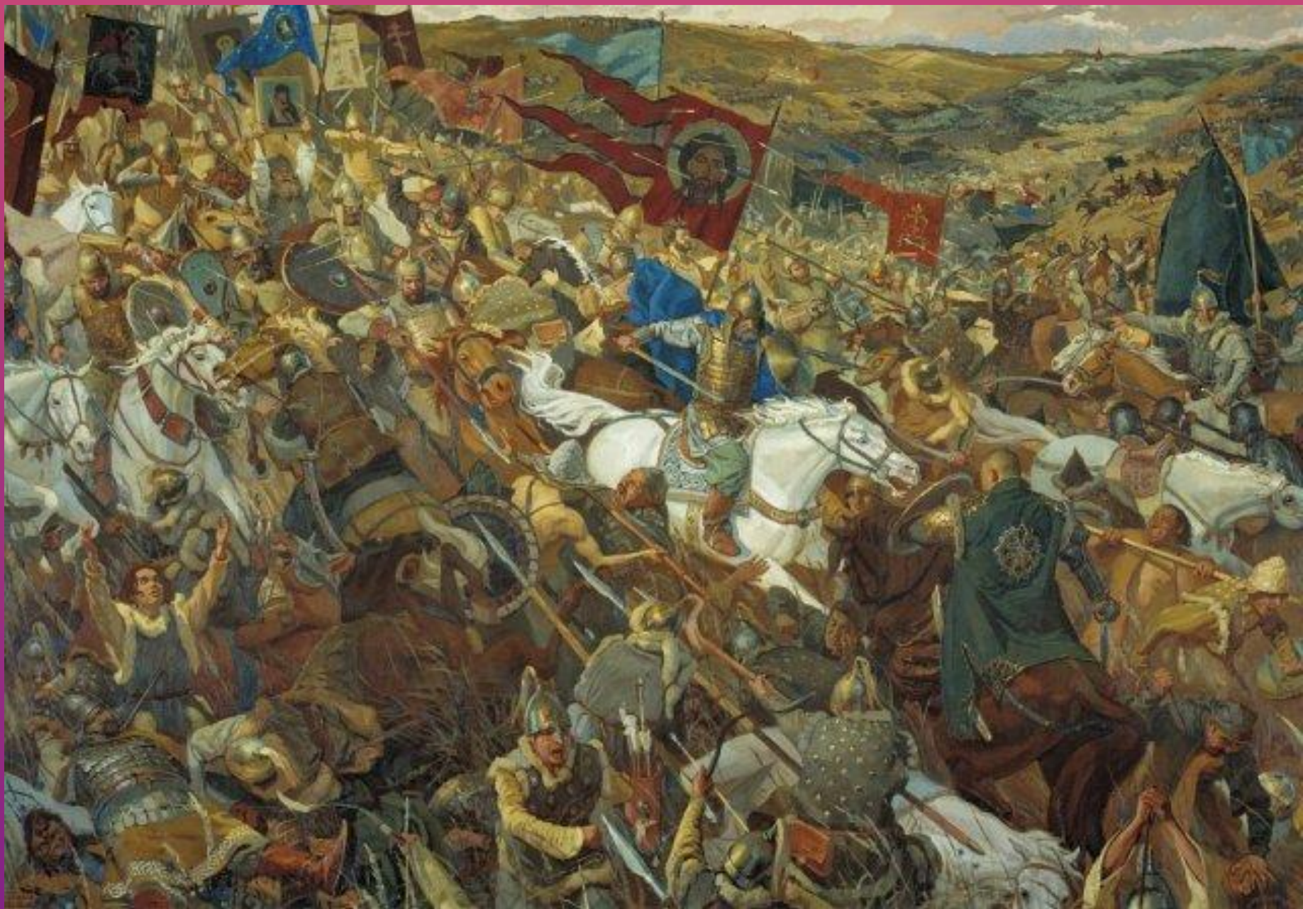
В. Маторин. Удар засадного полка