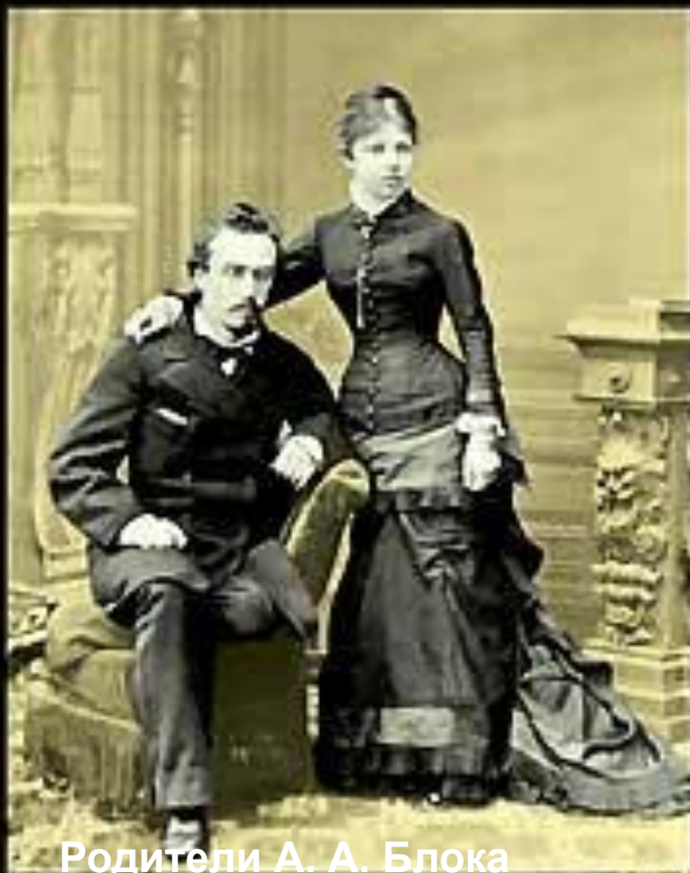
Родители А. А. Блока