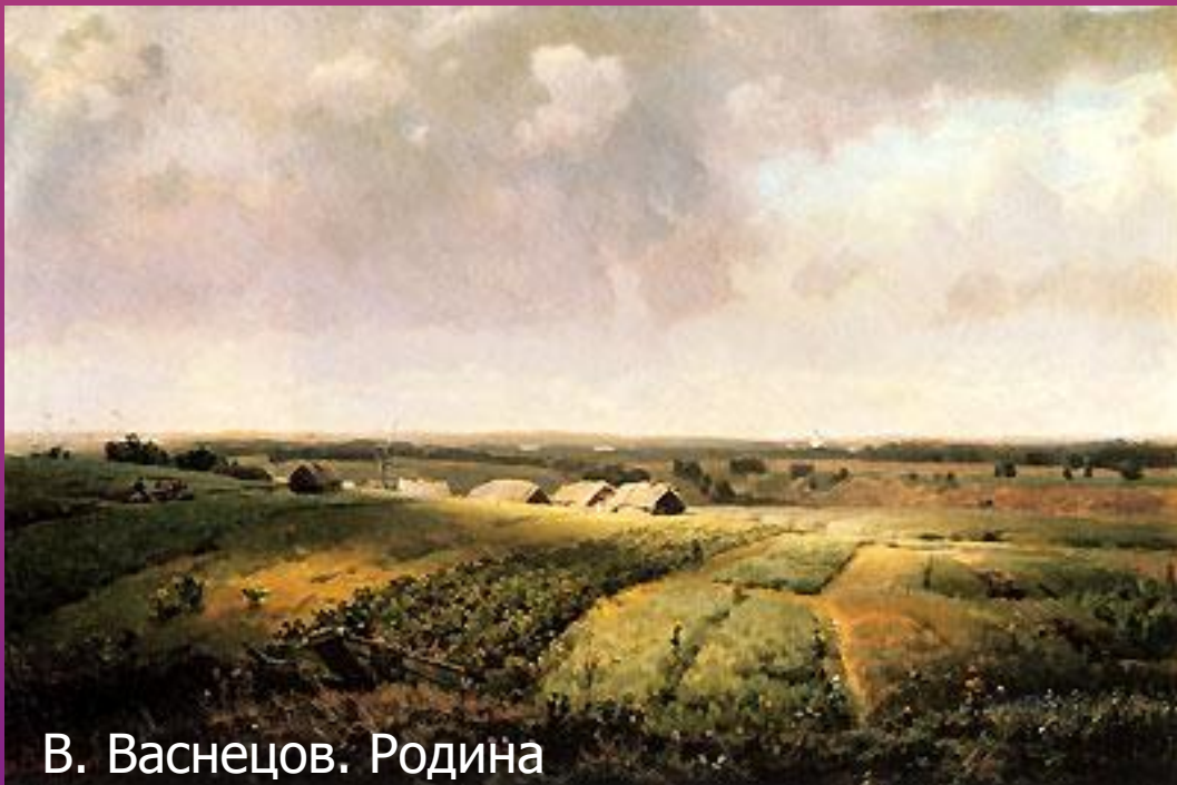
В. Васнецов. Родина