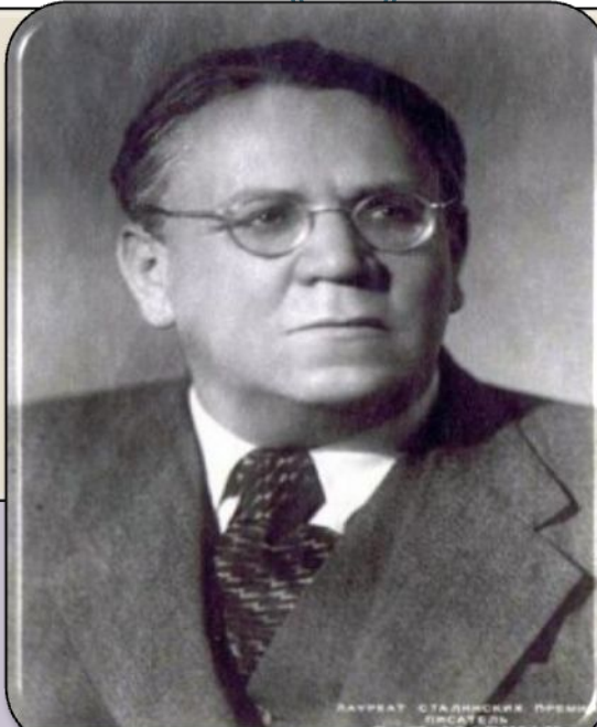
Самуил Маршак . Стихотворение "Расставание"

ДЖОРДЖ ГОРДОН БАЙРОН ПАЛОМНИЧЕСТВО ЧАРЛЬД-ГАРОЛЬДА • ДОН-ХУАН