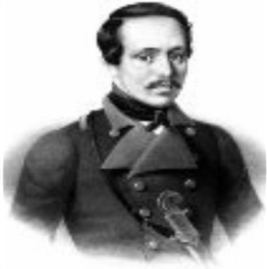
Михаил Лермонтов. Стихотворение "Душа моя мрачна..."