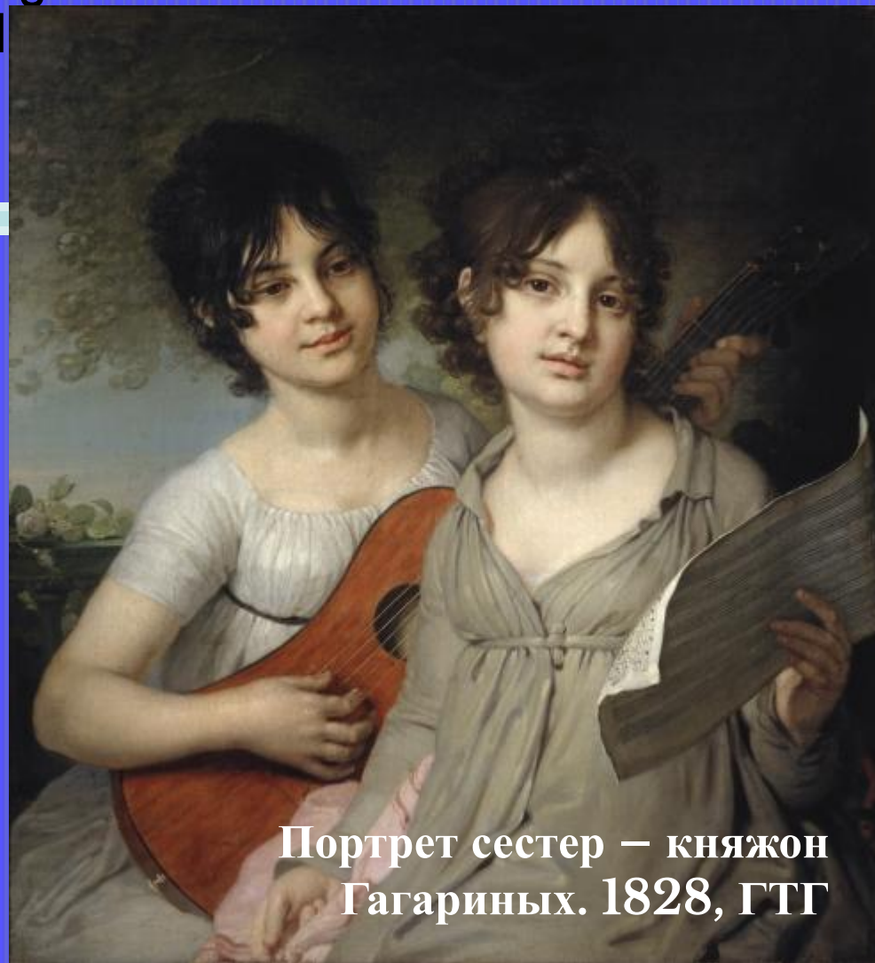
Портрет сестер – княжон Гагариных. 1828, ГТГ

В начале 1790-х Боровиковский обратился к жанру камерного портрета, чаще всего изображая женщин в домашней обстановке.