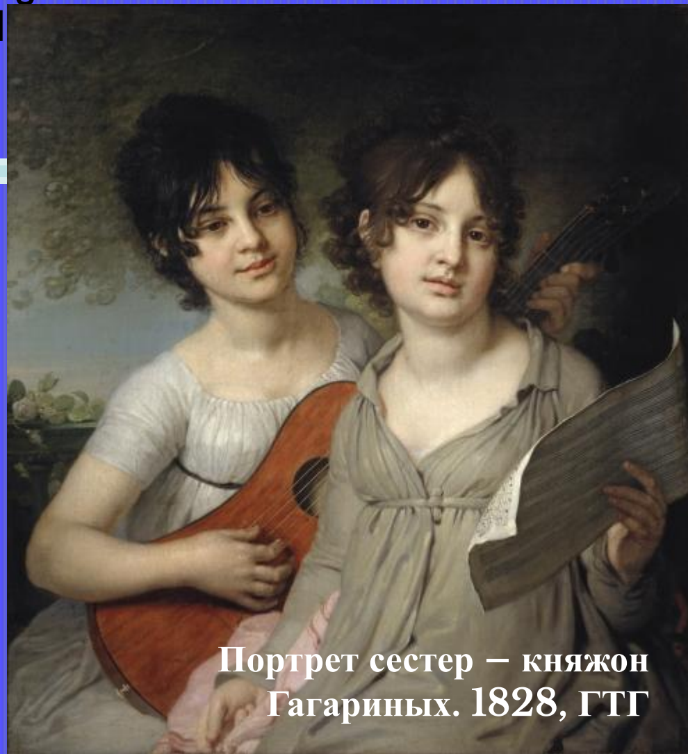
Портрет сестер – княжон Гагариных. 1828, ГТГ

В начале 1790-х Боровиковский обратился к жанру камерного портрета, чаще всего изображая женщин в домашней обстановке.