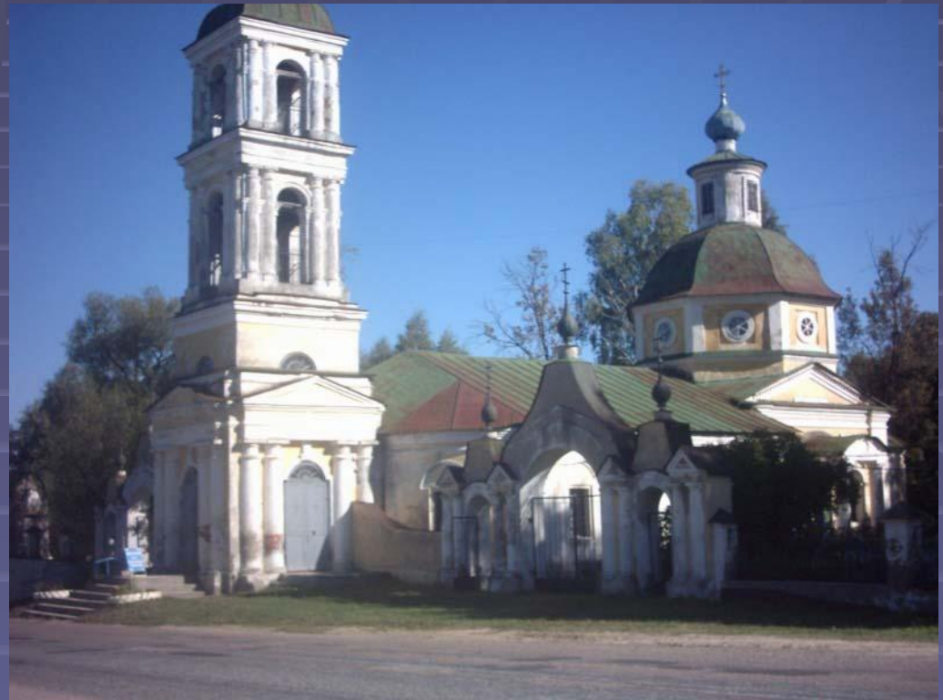
Спас-Угол - родина Салтыкова-Щедрина.