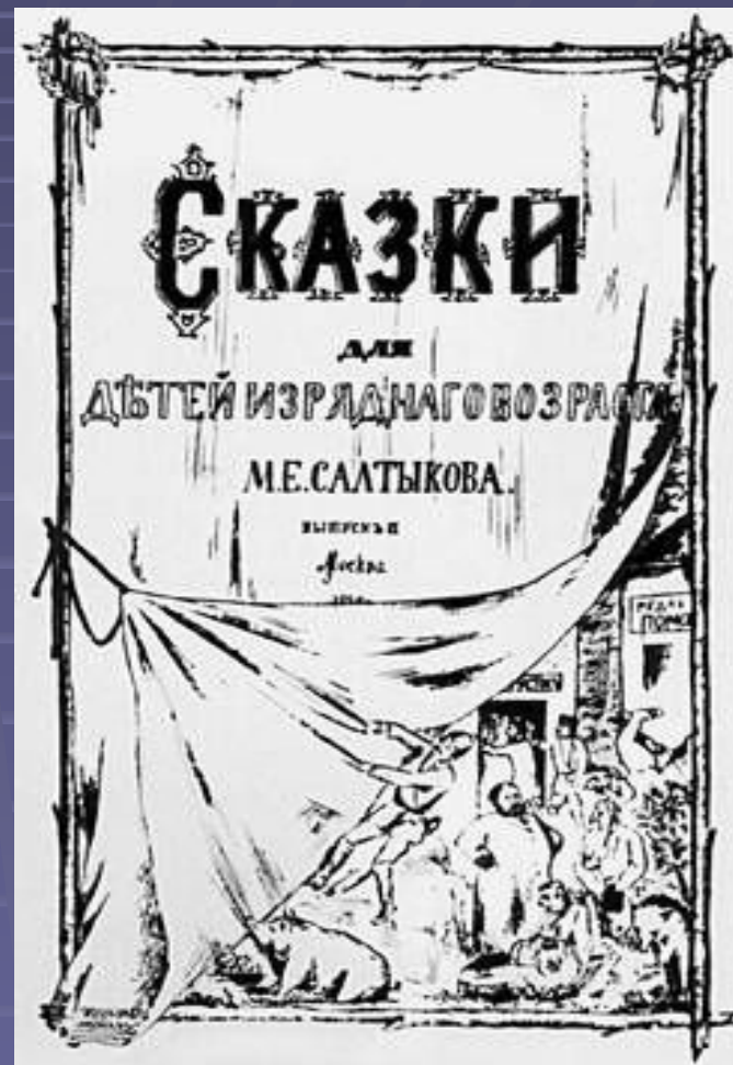
Литографированное нелегальное издание 1884.