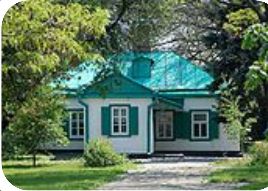
Отчий дом писателя в Таганроге

Детство и юность писателя прошли в Таганроге.