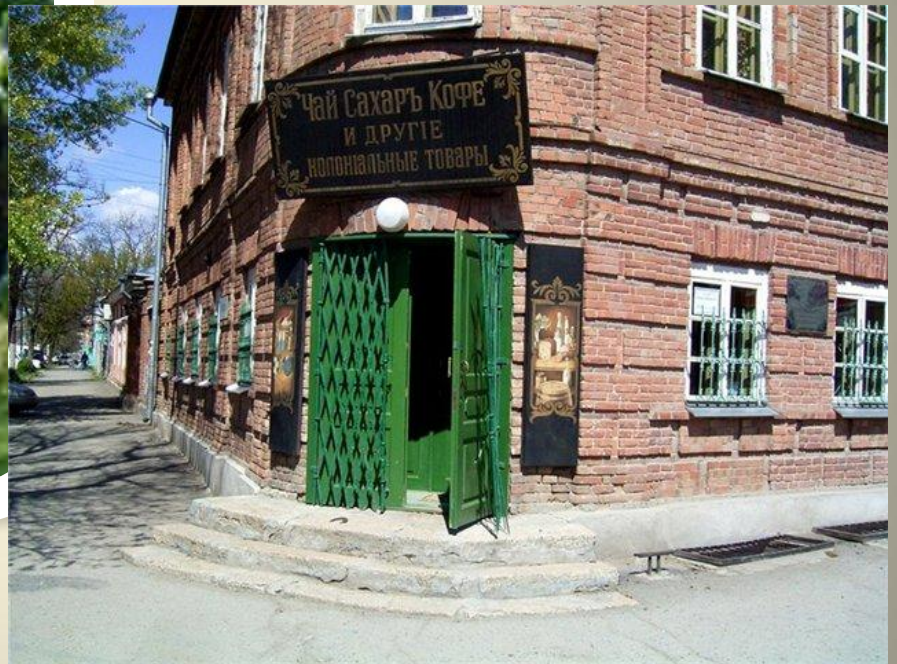
Лавка семьи Чеховых