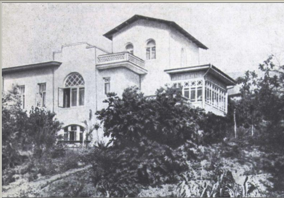
Дом в Ялте

Памятник Антону Павловичу в Ялте Приморский парк.