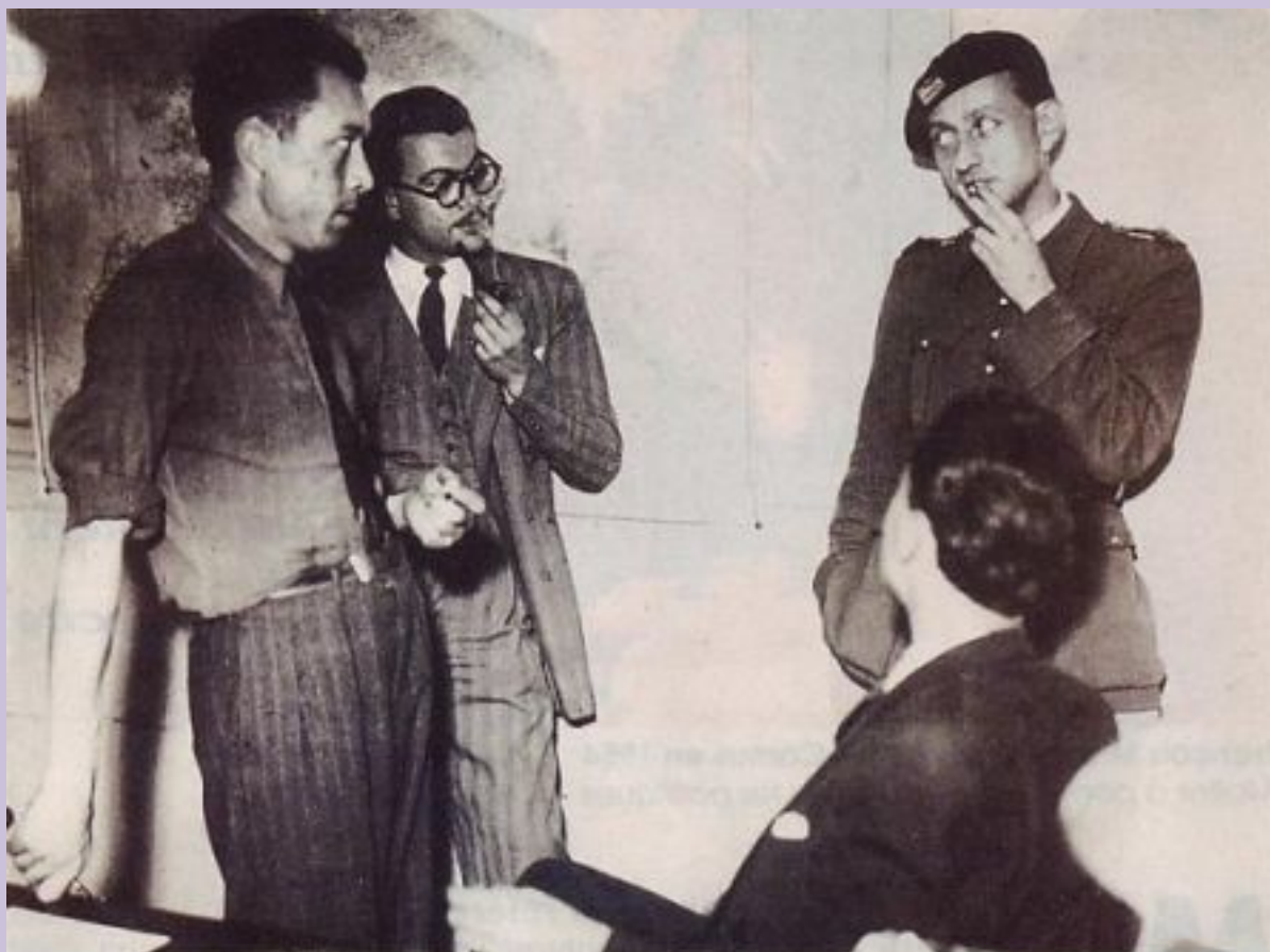
Albert Camus, Jacques Baumel, André Malraux à « Combat » en septembre 1944