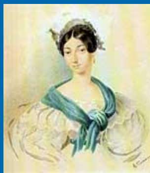
Сестра, Ольга Сергеевна Павлищева (1797-1868г.)