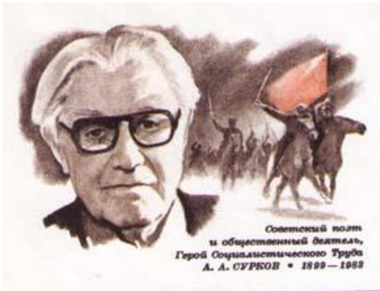
Советский поэт и общественный деятель, Герой Социалистического Труда А. А. СУРКОВ • 1899 — 1983