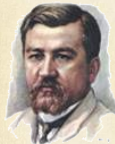
Александр Иванович Куприн

Александр Иванович Куприн любил русскую природу, превосходно знал характер и повадки птиц и животных. Он написал много рассказов о собаках, кошках, слонах, птицах, лошадях. Свои рассказы о животных Куприн не выдумывал. Все животные, о которых он писал, жили на самом деле: многие из них в доме Куприна, другие – у друзей, о судьбе некоторых он узнавал из газет.