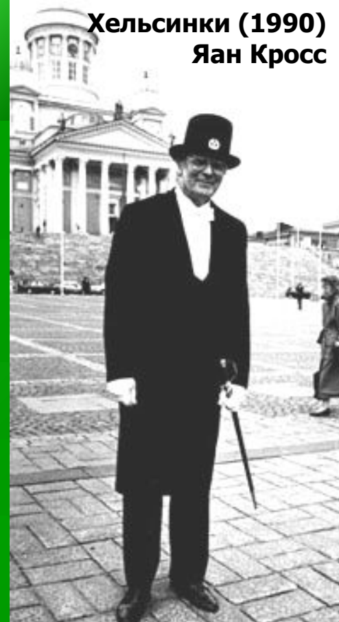
Хельсинки (1990) Яан Кросс

1994 – Государственная премия в области культуры за вклад в литературу