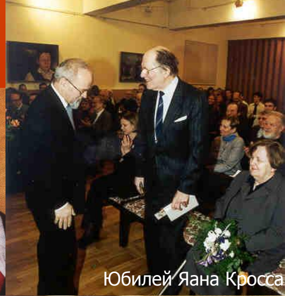
Юбилей Яана Кросса

В настоящее время Яан Кросс имеет множество литературных наград, является почётным доктором Тартуского и Хельсинского университетов, состоит в литературных союзах Эстонии и Финляндии. Его произведения переведены на множество языков мира.