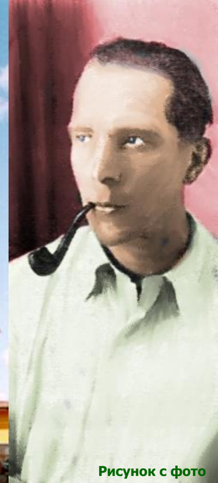
Рисунок с фото

Подробнее о самом Тартуском университете вы можете узнать на сайте www.ut.ee