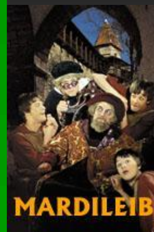
Афиша к недавно поставл- енному спектак- лю по мотивам произв- едения Яана Кросса «Мартов хлеб»