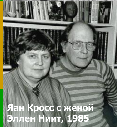
Яан Кросс с женой Эллен Ниит, 1985