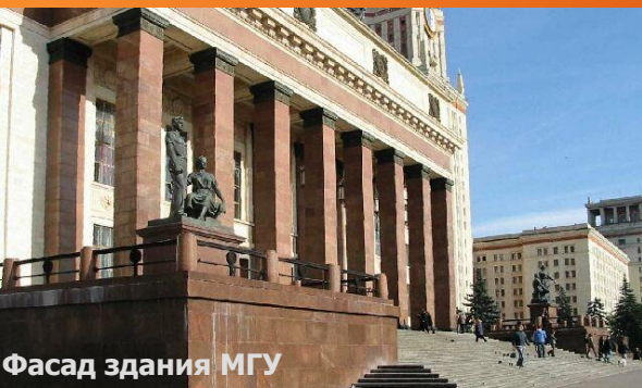
Фасад здания МГУ