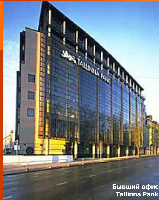
Бывший офис Tallinna Pank

В период с 1941 по 1943 Яан Кросс занимает должность секретаря Tallinna Pank