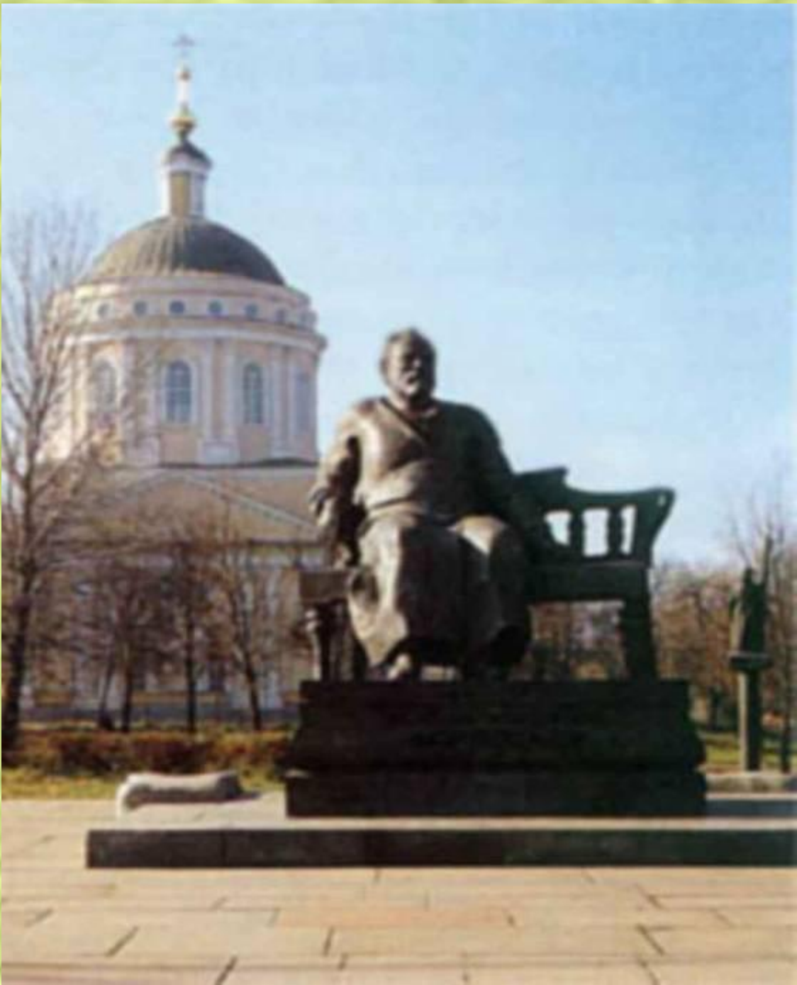
Памятник Н. С. Лескову в Орле