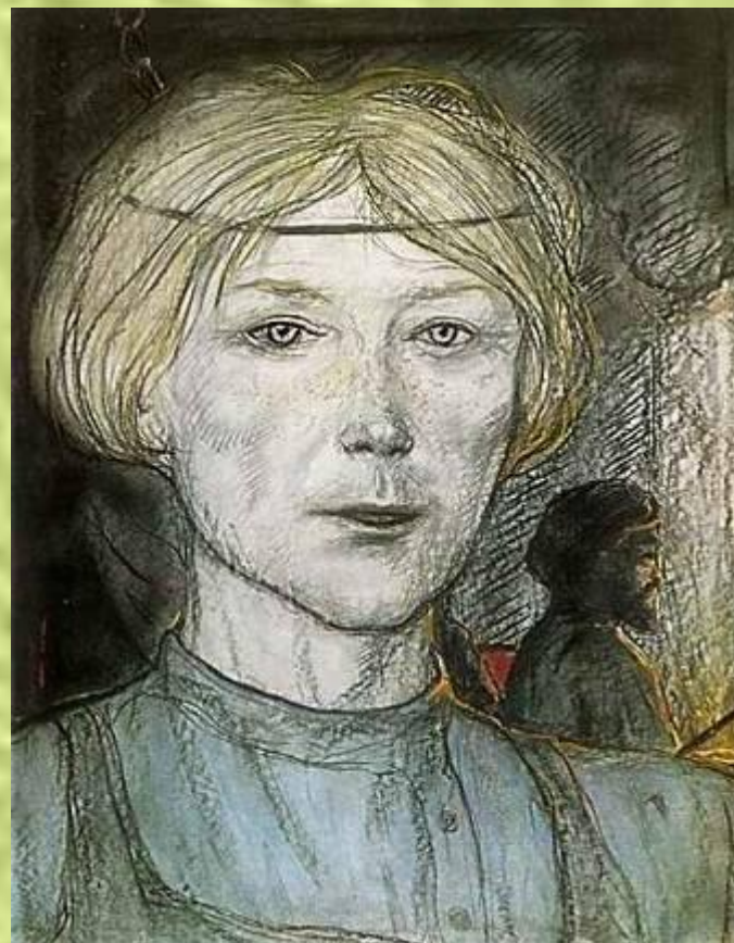
художник И. Глазунов