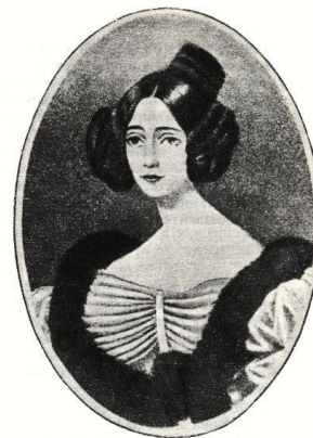
Графиня Е.П. Ростопчина