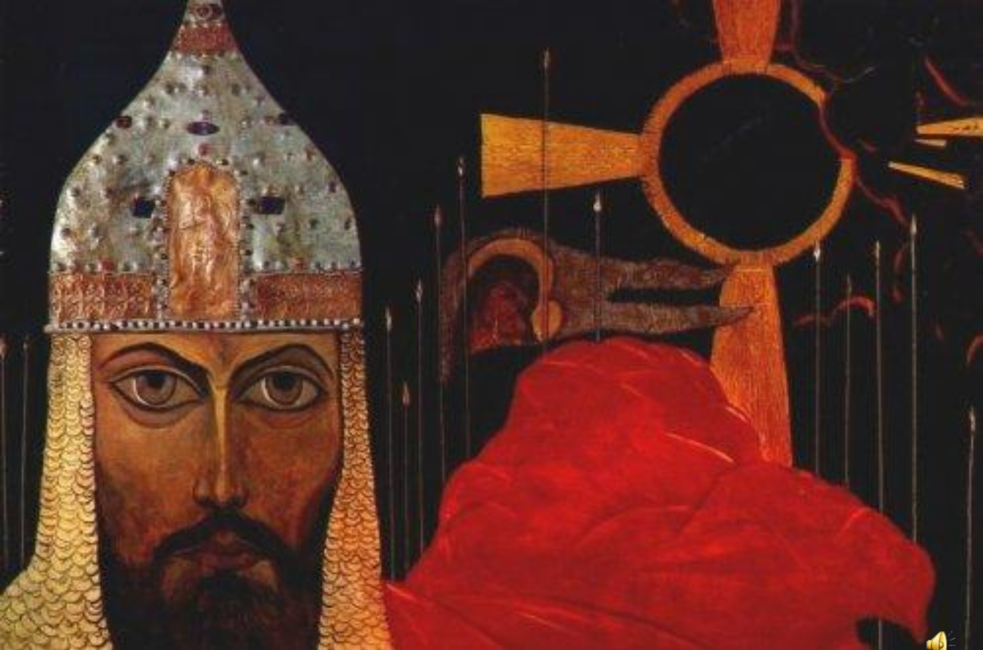
Н.К.Рерих "Поход Игоря". 1942. и «Князь Игорь» Государственный Русский музей.