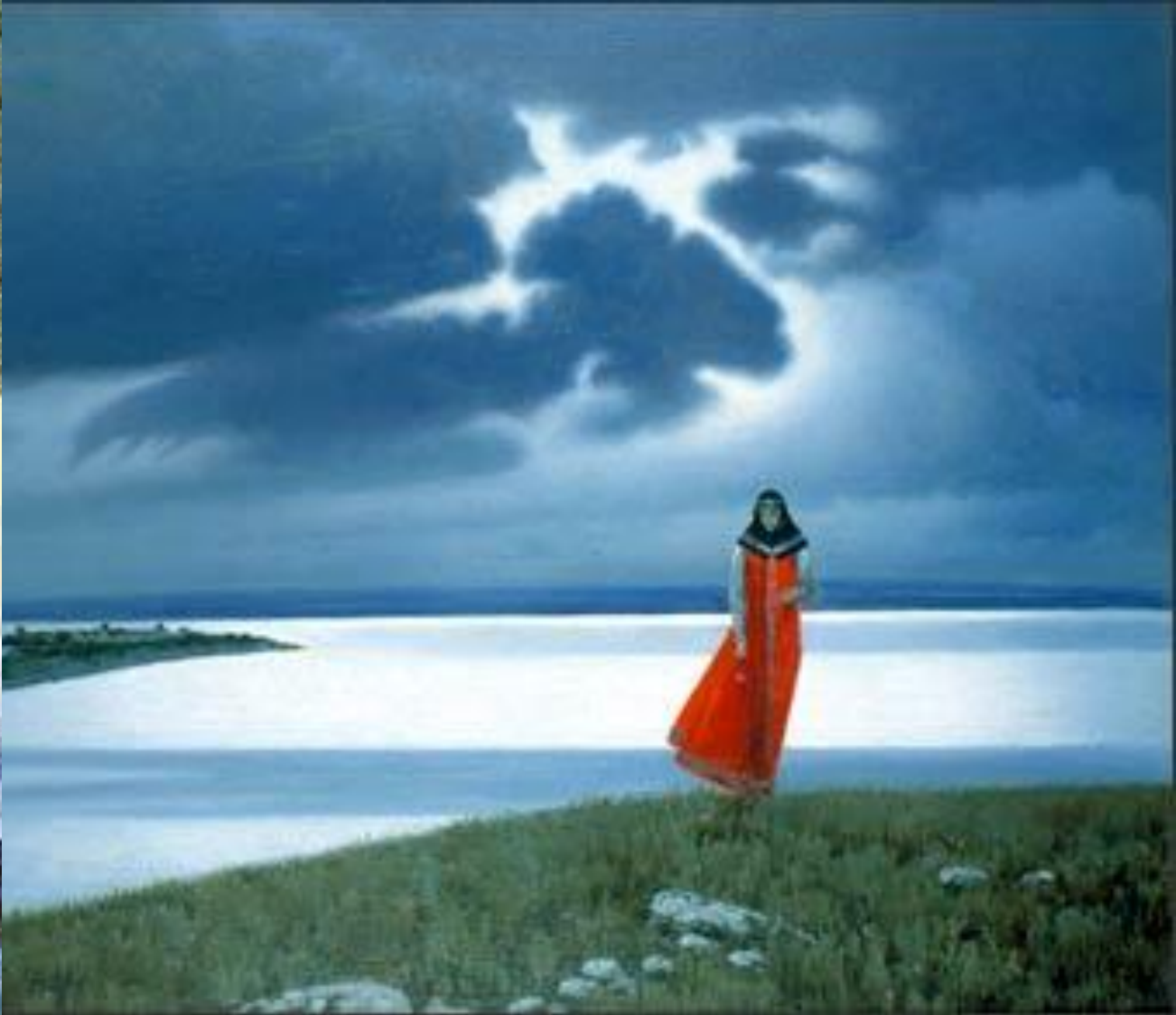
Константин Алексеевич ВАСИЛЬЕВ. «Плач Ярославны»