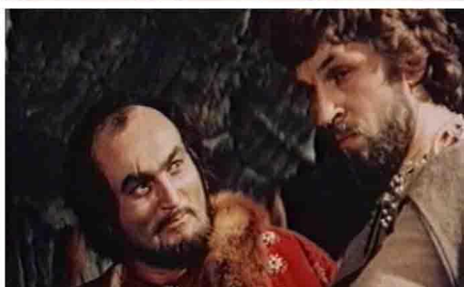
А.П.Бородин. Князь Игорь. Фильм-опера