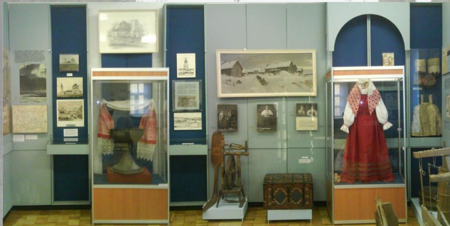
Зал №2 Север- родина Ломоносова