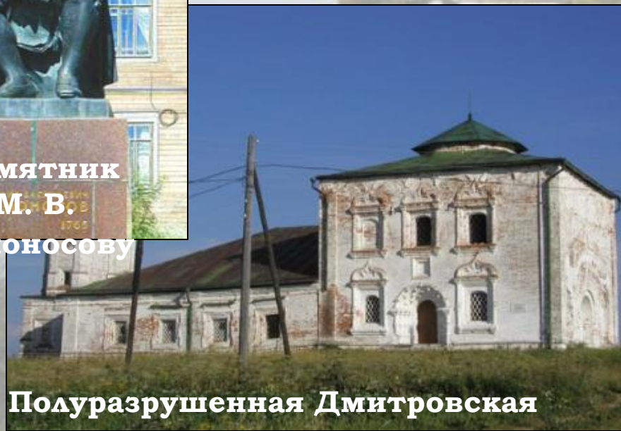
Полуразрушенная Дмитровская церковь