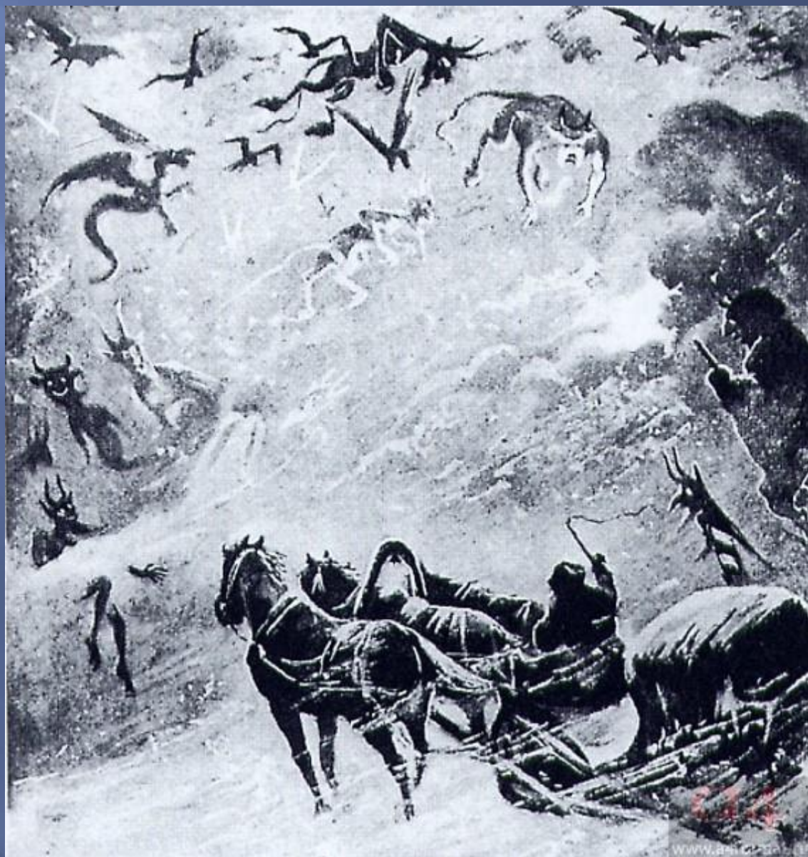
«Бесы». Художник И. Симаков. 1904