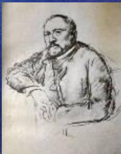
Портрет Н. С. Лескова работы И. Е. Репина