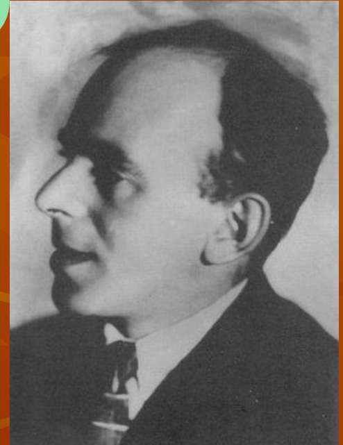
Стихотворение «В том времени, где и злодей...»