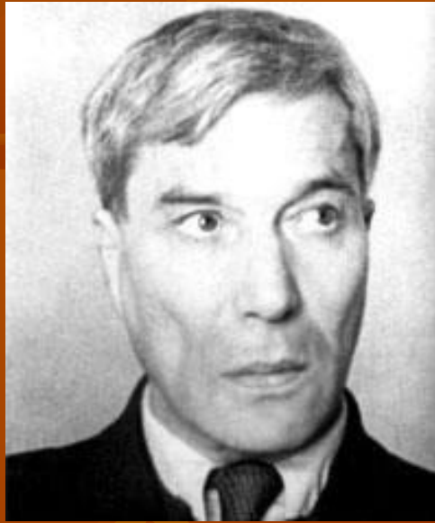
Стихотворение «Памяти Бориса Пастернака»