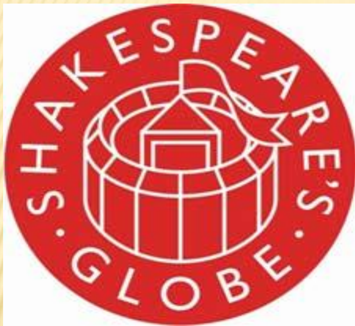
ЭМБЛЕМА СОВРЕМЕННОГО ТЕАТРА «ГЛОБУС»