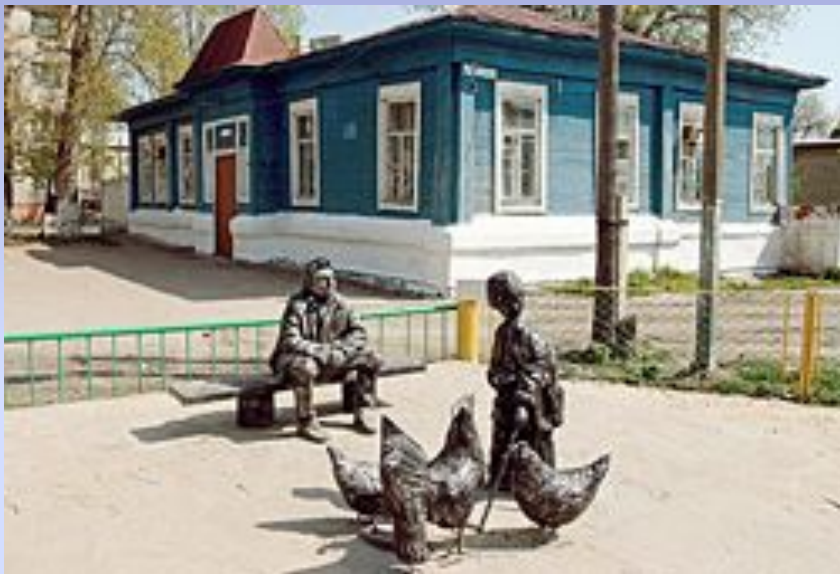
Урюпинск. Памятник героям рассказа «Судьба человека»