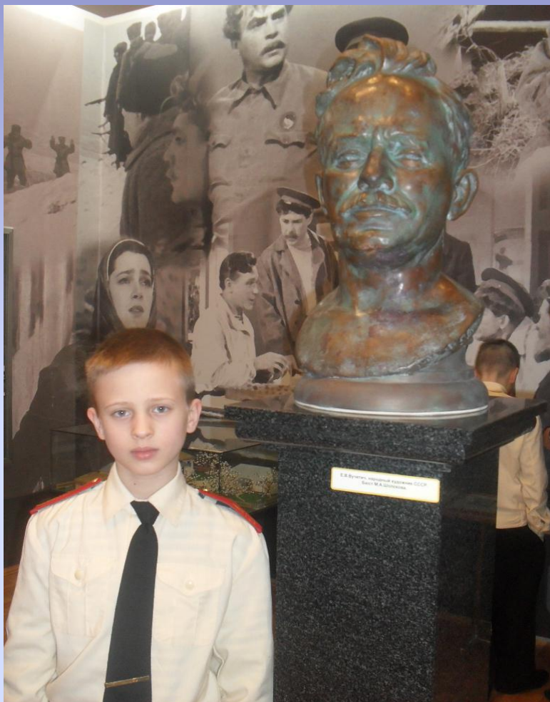
Фото. Мемориальная комната-музей М.А.Шолохова в МККК им.М.А.Шолохова.