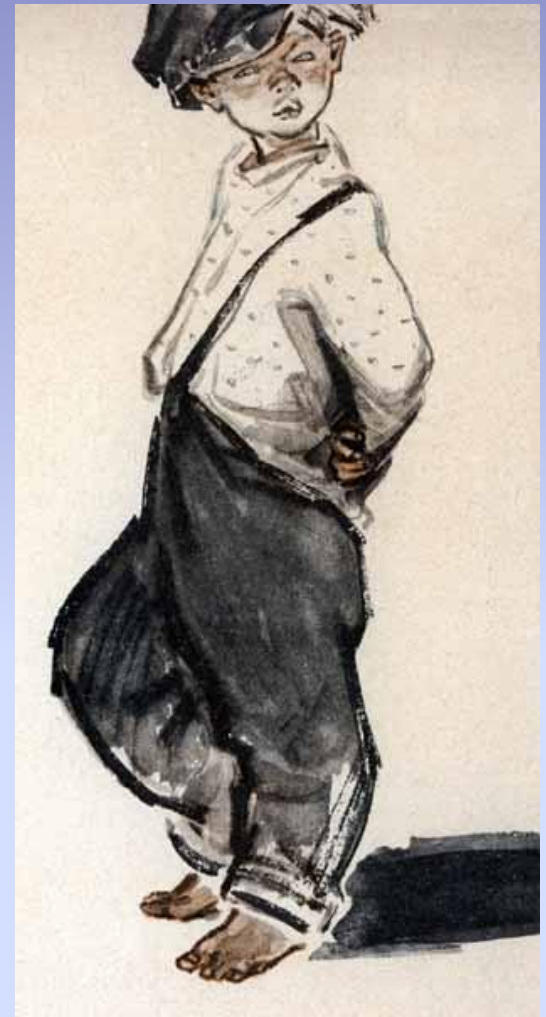
Иллюстрация к рассказу «Нахалёнок». Худ. А. Мосин.