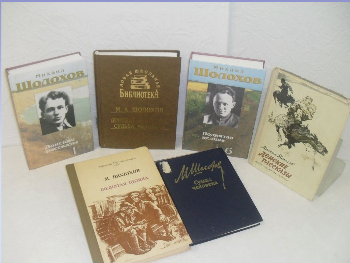
Фото. Книги М.А.Шолохова из библиотеки Корпуса.