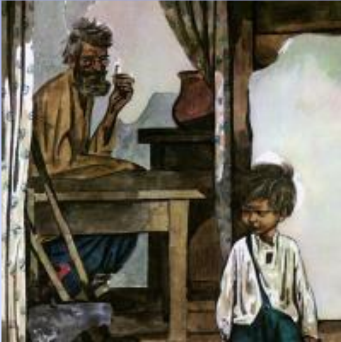
Иллюстрация к рассказу «Нахалёнок». Худ. В. Юдин.