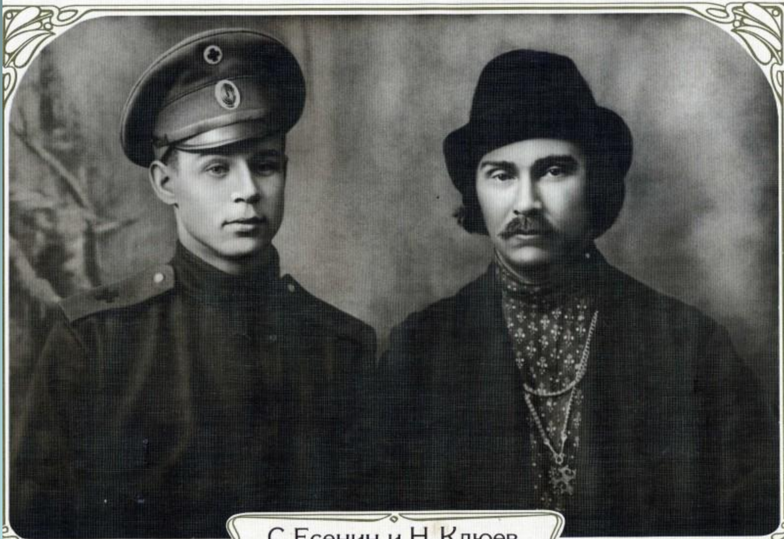
С.Есенин и Н.Клюев 1916 г.